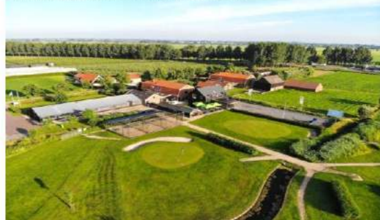
Herbestemming Maria Johanna Hoeve Noordeloos