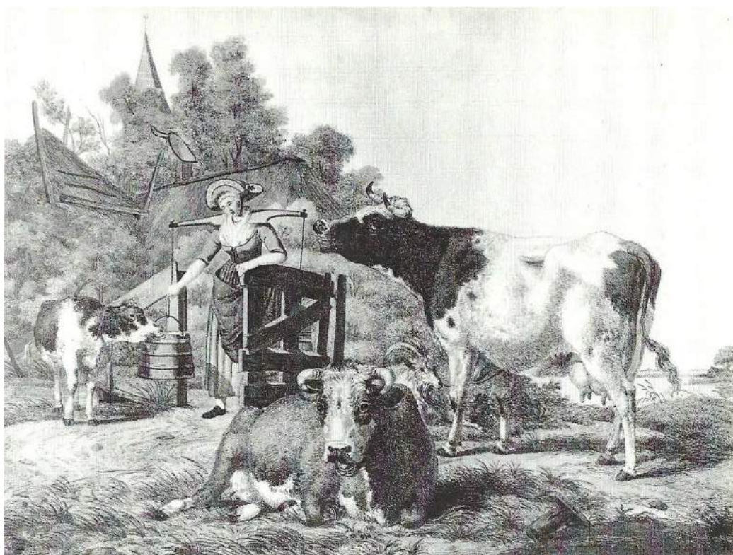
Hollandse melkkoeien; uit: Natuurlijk Historie van Holland van Van Berkhey.

Met dank aan: Geertje Dekkers NRC 12.02.2021.