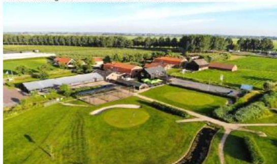
Herbestemming Maria Johanna Hoeve Noordeloos