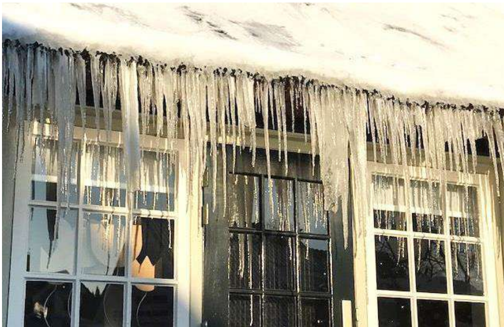
Een natuurlijk wonder, dankzij een rieten dak, temperaturen onder nul en een binnen brandende verwarming.