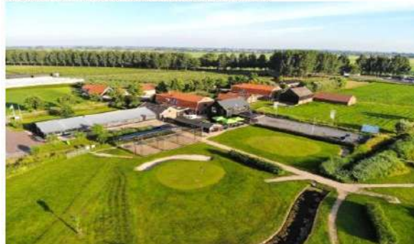
Herbestemming Maria Johanna Hoeve Noordeloos