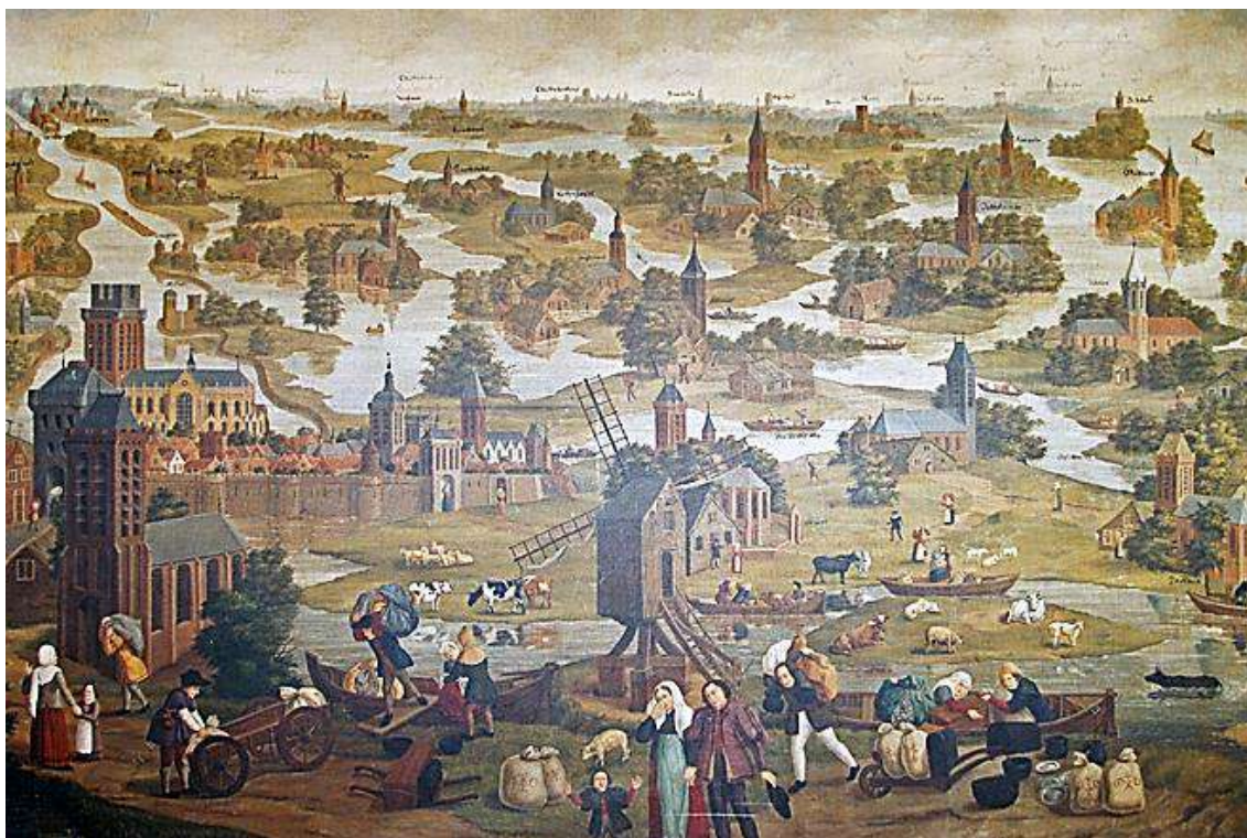
Anonieme schilderij, waarop tal van voorbeelden te zien zijn van middeleeuws boeren.

Dit jaar wordt er op verschillende plekken en manieren aandacht geschonken aan de ondergang van de Grote of Zuid-Hollandse Waard, zo'n 600 jaar terug. Dit grote gebied lag ten zuiden van de Alblasserwaard, aan de overkant van de rivier de Merwede en is qua structuur vergelijkbaar met het werkgebied van Boerderij & Erf AKV. Aanleiding tot dit artikel hierover in de nieuwsbrief van deze organisatie is vooral ook de ten tijde van de ramp aan de gang zijnde overgang van akkerbouw naar veeteelt, zoals in die tijd ook in ons werkgebied gebeurde.