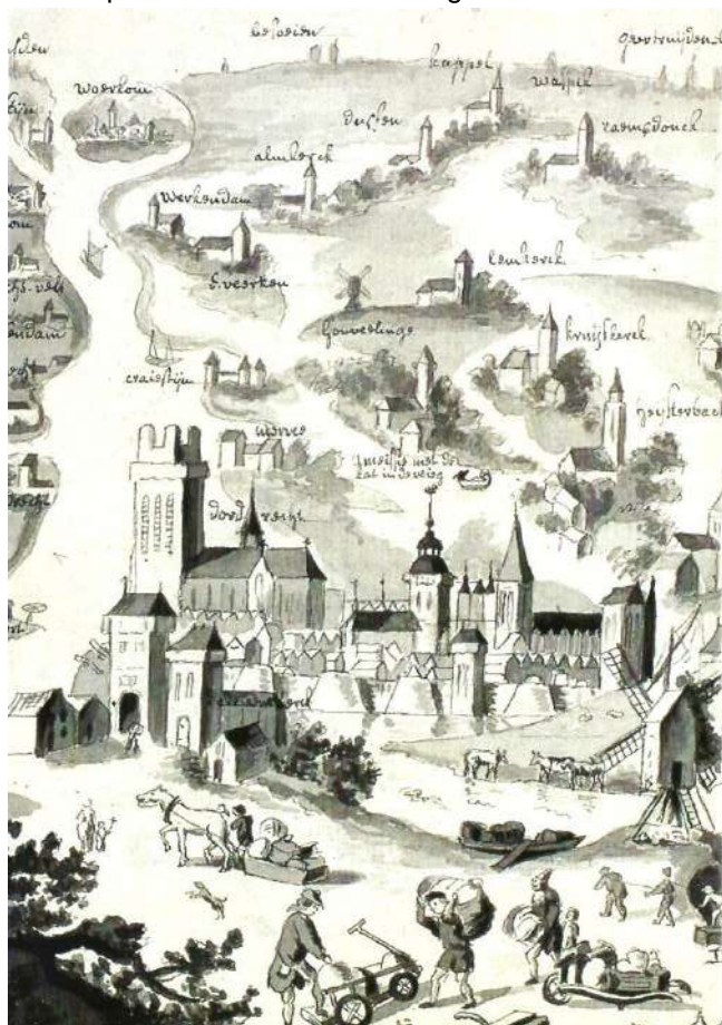
Detail van een tekening door E.H. Schoemaker, naar voorbeeld van Arnoldus Houbraken uit 1676 (stadsarchief Dordrecht).

Nadat al in 1372 en 1373 door het hoge water veel schade was opgelopen wordt de toestand in 1374 (9 oktober) erg kritiek in de Grote of Zuid-Hollandse Waard, Riederwaard en Zwijndrechtse Waard. In 1375 loopt de Grote Waard opnieuw grote averij op. De Riederwaard, waar men dan nog met het herstel bezig is gaat bij deze vloed, samen met de nederzettingen Ridderkerk, Pendrecht, Donkersloot en Rhoon, verloren.