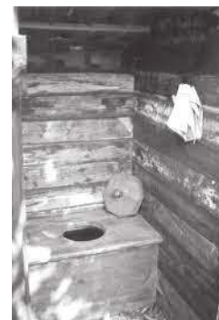
Met dank aan Ewoud Sanders.

Bij woorden die in de taboesfeer liggen, en daar hoort plee zeker bij, zie je vaak dat de uitspraak wordt veranderd. Dat is bij plee ook het geval. Net zoals er mensen zijn die wc verkorten tot wee, zijn er lieden die plee uitspreken als pluh of zelfs plè. En natuurlijk komen we dit woord ook in verkleinde vorm tegen, want dat is dé Nederlandse manier om alles lieflijker te doen klinken. Zo zijn er mensen die aankondigen dat ze even een pleetje gaan pikken. Ook wordt plee op schrift soms afgekort tot pl. Sommigen hebben het bij plee over een zekere plaats of geheim gemak, heimelijkheid, pleti, afgekort tot plé of pl, bestekamer, afgekort tot beste, sekreet, privaat, huisje of kantoortje, retirade, numero honderd, cour, toilette, cabinet, watercloset, abort of W.C.