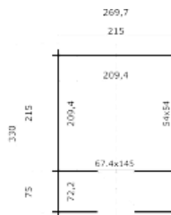
Iemand die een beetje handig is maakt zelf een buitenplee, om te gebruiken als tuinschuur en om uit te rusten...