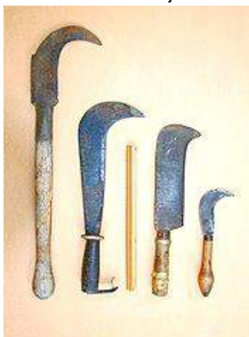
Verschillende typen hiepen. (De duimstok in het midden is 30 cm lang.)

der meer de naam hiep genoemd. Een hiep of handslagmes is een stuk gereedschap dat vooral wordt gebruikt bij beheer van het landschap. Met name voor het afhakken van rijshout in de grienden. Ook de boeren gebruikten ze bij het knotten van de wilgen en vroeger ook bij het maken van vlechthekken. Een hiep is ook uitermate geschikt voor het hakken van aanmaakhout; veel beter dan een bijl. Je moet hem echter wel goed weten hanteren.