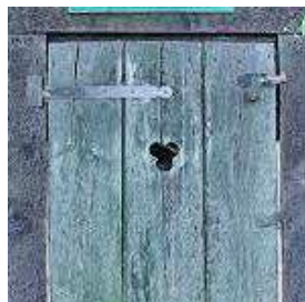
Het kleine gaatje, bedoeld om binnen wat licht te hebben hoort eigenlijk de vorm van een hartje te hebben.