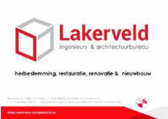
Herbestemming Maria Johanna Hoeve Noordeloos