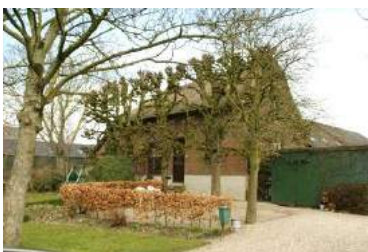
Van boven naar beneden: Everdingen, Kedichem en Leerbroek.

Dat vinden van een nieuwe functie is belangrijk, omdat er boerenbedrijven stoppen. De samenleving om ons heen ontwikkelt zich. Er is een streven naar steeds meer en alsmaar sneller. B&E AKV wil daar op inspelen. Niet alleen waar het gaat om oude historische bebouwing (in de bewoningslinten), maar ook voor de nieuwe boerderijen (vaak in ruilverkavelingslinten, maar ook elders). Om dat gedegen te kunnen doen moet je weten waar je over praat. Een goed gefundeerd advies of het voorbereiden van besluitvorming gebeurt in de praktijk nogal eens vanachter een bureau. Logisch, want vaak ontbreekt het aan voldoende menskracht om overal voor het veld in te gaan. Een plaatje van het betreffende object is dan een eerste vereiste. Datzelfde plaatje is van groot belang voor andere doeleinden. Om de streek te presenteren voor het publiek: mensen van hier, maar ook toeristen, bestuurders van elders enzovoorts.