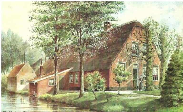
Een voorbeeld van een boenhok met lessenaarsdak. Tekening van een boerderij te Rietveld bij Woerden. Aquarel van J. Verheul Dzn.

Naast de opritten en achter de boerderij staan stalgebouwen, wagenschuren, beide in een enkel geval gecombineerd met zomerhuizen, hooischuren of hooibergen. Over het algemeen zijn dergelijke gebouwen en bouwwerkjes eenvoudig van uitvoering: zij hebben meestal een rechthoekige plattegrond, zijn eenbeukig en liggen onder een zadeldak. Al naar gelang de functie zijn zij opgetrokken van steen, een combinatie van steen en hout (stalling) of uitsluitend van hout (hooiberging).