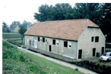
Van boven naar beneden: Arkel, Bleskensgraaf en Papendrecht