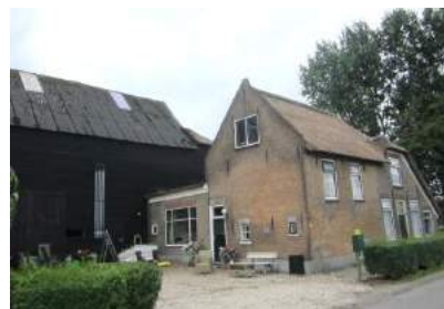
Van links naar rechts: Bergambacht, Schoonhoven en Stolwijk.