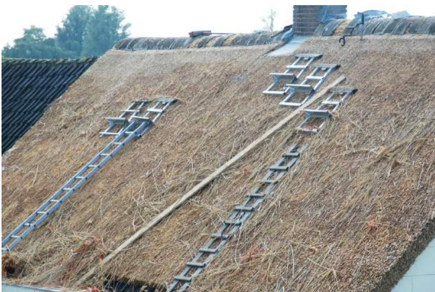
De rietdekker is gekomen.

Op dit moment kun je prachtige foto's maken, maar er zijn enkele problemen. De bladeren komen weer aan de bomen, zodat het zicht op veel zaken wordt weggenomen. Er is door de ernstige omstandigheden waarin we ons bevinden sprake van een quarantaine. Weliswaar vrijwillig, maar laten we ons gezonde verstand gebruiken en even niet doen wat niet beslist moet. Binnenkort gaat er een verzoek uit naar het Prins Bernhardcultuurfonds Zuid-Holland en het Erfgoedhuis Zuid-Holland, om de afwikkelingen en afrekening van het project met minstens een jaar te mogen verlengen. Dan hoeven we niet eind 2020 klaar te zijn, maar hebben we nog een heel jaar extra. Voor de kwaliteit van het fotoarchief en van de beeldbank van groot belang.