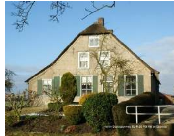
Van links naar rechts: Streefkerk, Berkenwoude en Hei- en Boeicop.