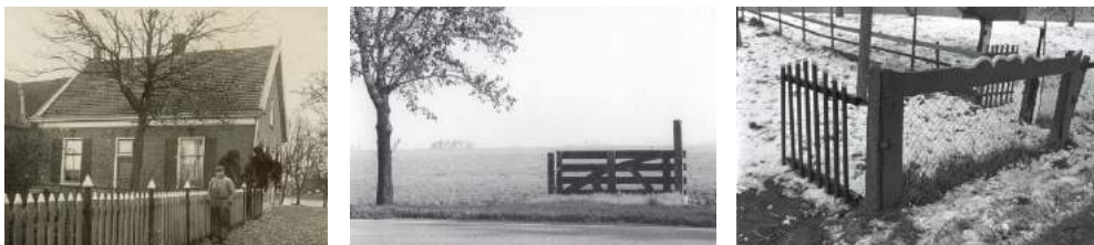
Drie maal: 'zonder titel'.

Inmiddels zijn de houten hekken een verdwijnend fenomeen. Slietenhekken zie je eigenlijk bijna nergens meer, de karakteristieke houten boerenhekken volgen ongetwijfeld. Op veel plaatsen zijn ze gaandeweg al vervangen door metalen of kunststof exemplaren. De zo gewoonlijk ogende houten boerenhekken zijn daarmee verbannen naar de brandstapel.