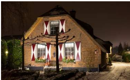
Hei- en Boeicopseweg

vanuit de subsidieregeling Cultuur en Erfgoed, waarbij cultureel erfgoed en de verhalen die erbij horen toegankelijk worden gemaakt voor publiek. Ook is er ondersteuning vanuit de gemeente Vijfheerenlanden en diverse andere organisaties.