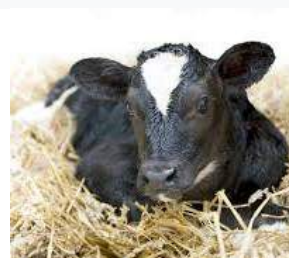
Lekker in het stro.