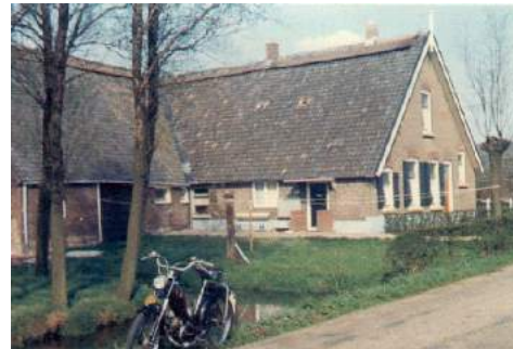
Zowel boerderij als bromfietst zijn niet meer...