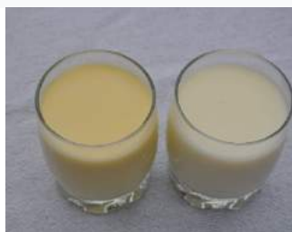
Biest en melk.