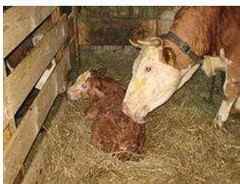
Kort na het kalven.

Biest is de eerste melk van de koe na het kalven; krachtvoer voor het pasgeboren kalf. Het is dikker en geler dan gewone melk en bevat veel afweerstoffen. Na de eerste dag loopt de hoeveelheid afweerstoffen snel terug en komt de gewone melkproductie op gang. Een net geboren zoogdier heeft nog geen eigen afweer en daarom is het belangrijk dat het biest drinkt.