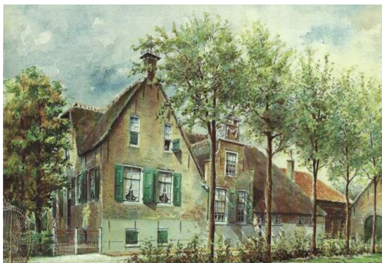
Bovenbergseweg Bergambacht (aquarel van J Verheul Dzn.)

Redactie en samenstelling: TEKSTWERK & CO - Bureau Tekstwerk | Dick de Jong | djtekst@planet.nl | 06-22845889