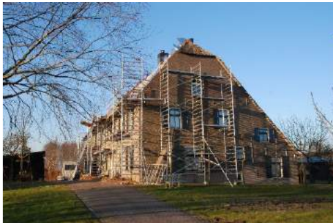
Gelukkig zijn die steigers al geruime tijd weg.

Op dit moment wordt gewerkt aan een stuk dat is bestemd om als leidraad te dienen bij het optimaliseren van de beeldbank en vervolgens worden degenen benaderd die hebben aangegeven hand- en spandiensten te willen verrichten. Tegelijkertijd gaat er weer een algemene oproep uit om meer vrijwilligers te werven. Uiteraard hoeft u daar niet op te wachten en kunt u reeds nu reageren.