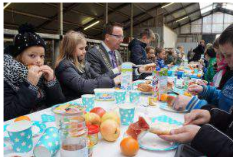
Een schoolontbijt tijdens het evenement.