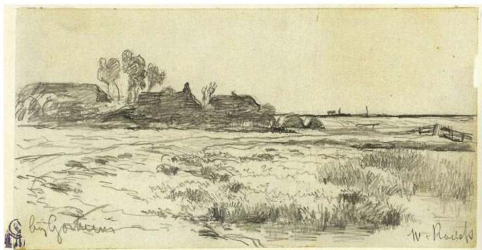
Tekening van Willem Roelofs, titel 'Bij Gorcum'. 106 x 204 mm. Gemeentemuseum Den Haag.

Redactie en samenstelling: Bureau Tekstwerk – Dick de Jong - djtekst@planet.nl – 06-22845889