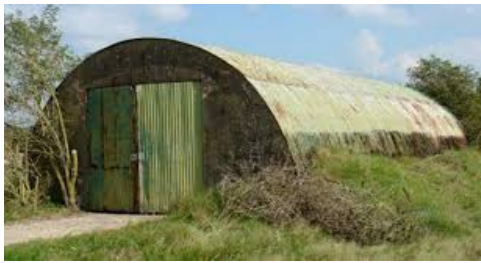
Romneyloods van de Scheluinse Landbouworganisatie 'Samen Sterk'