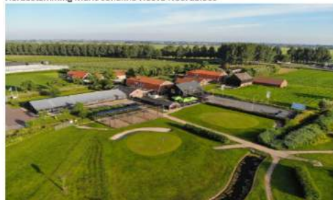
Herbestemming Maria Johanna Hoeve Noordeloos

Hoofdvestiging: KGEZ, PL, Noordeloos • T 0183 384000 • info@lakerveld-noordeloos.nl Kantoor Noordeloos: 2897121 • info@kroon 28 112 26 577 • 4049 NL 36 4100 100 1100 79 • 812 8100 30 www.lakerveld-noordeloos.nl