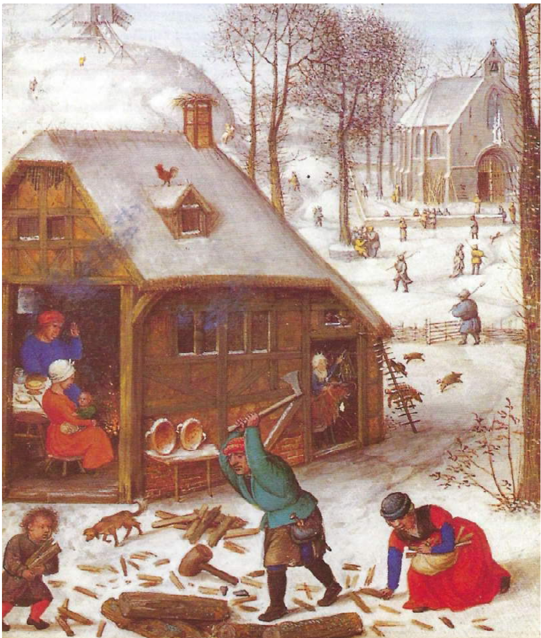
Boeren in de middeleeuwen: het geheel gezin doet mee. Prent uit het Getijdenboek van Simon Bening.

van het huwelijk en kwamen samen overeen waaruit de feestelijkheden bestonden. Wel was vaak ook de toestemming van de landheer nodig. Het feitelijke huwelijk bestond uit een jawoord dat in gezelschap van de familie werd uitgesproken. Van een kerkelijk huwelijk was nog geen sprake. Het hoofbestanddeel van een huwelijk was een overvloedige maaltijd. Doel van het huwelijk was uiteindelijk dat er kinderen moesten komen. De kindersterfte was hoog. Per acht geboren kinderen bereikten er veelal maar twee of drie de volwassen leeftijd. En dat gold dan bij de boeren; in arme gezinnen was de ellende nog groter. De levensverwachting in de vroege middeleeuwen was slechts 25 jaar. Dit groeide in de late middeleeuwen uit tot 50 jaar. Op het platteland ging dit minder snel dan in de steden. De enige medische verzorging bestond uit nabuurschap en verder was een ziek lichaam geheel aangewezen om op eigen kracht beter te worden. Met wat geluk was er een klooster in de buurt waar wat hulp verkregen kon worden. Vooral de gezondheid van de boerin vormde een groot gevaar. Zij moest met haar relatief zwakkere constitutie niet alleen veldarbeid verrichten, maar ook de tuin onderhouden en het huishouden doen. Bovendien was ze bijna continu zwanger en elke bevalling hield risico in zich. Stierf een boerin vroegtijdig in het kraambed, dan was de weduwnaar louter op economische gronden genoodzaakt snel te hertrouwen.