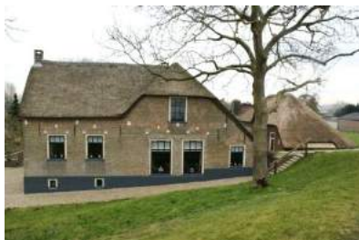
Drie rijksmonumentale boerderijen.