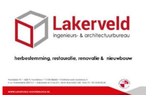
Herbestemming Maria Johanna Hoeve Noordeloos