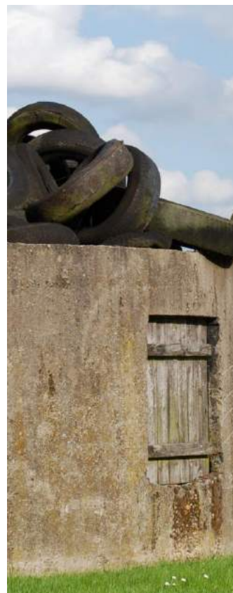
Detail van een ooit voorkomend alledaags beeld op vrijwel elke boerderij.

REDACTIE & SAMENSTELLING Dick de Jong - Bureau Tekstwerk