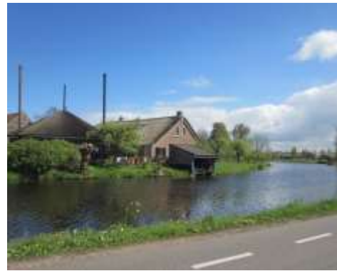
Langs de Vlist.