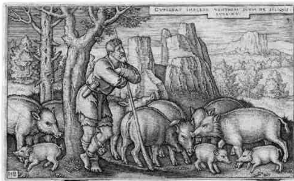
Koperprent uit 1538 van Sebald Beham (1500-1550)

Een voor andere zaken veel gebruikte dierennaam is die van het varken. En dan voornamelijk in de bouwnijverheid. Soms alleen het mannetjesvarken, de beer. Niet te verwarren met de bruine beer. Hier een opsomming van de benamingen: