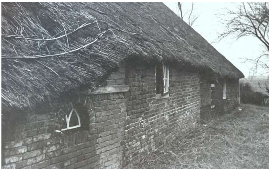
Weverwijk 18, in erbarmelijke staat...