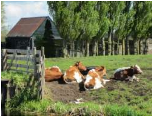
Koeien in Bergambacht.