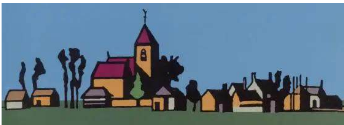
Landschap met boerderijen.