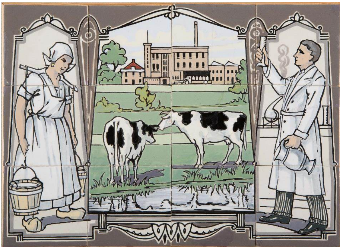
Tegeltableau uit de expositie 'Hier wordt gewerkt – beroepen op tegels', in het Tegelmuseum in Otterloo.

Als heel lang geleden, toen de eerste bewoners in ons gebied neerstreken noemden we die jagers-verzamelaars. Het onderdeel jagen is wat minder geworden, maar het verzamelen hebben we met elkaar flink in stand weten te houden. Niet meer het verzamelen van voedsel, die in de begintijd van bewoning ongeveer 90% van de beschikbare tijd in beslag nam, maar het verzamelen van dingen die we mooi, leuk, bijzonder vinden. Maar aan dat verzamelen komt een keer een eind. En dan gaan we ruimen. We moeten afstand doen van iets waar we op de een of andere manier aan gehecht zijn. Dat noemen we ruimen. Opruimen heeft bij ons meer de betekenis van iets netjes maken, orde en netheid scheppen.