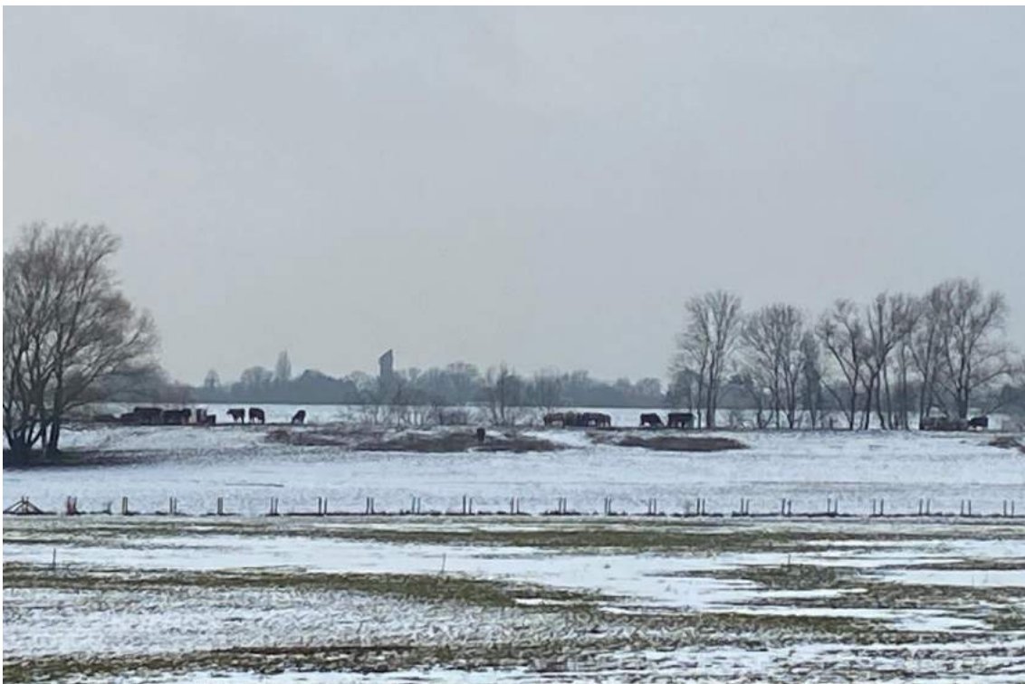
Koeien in de winter.