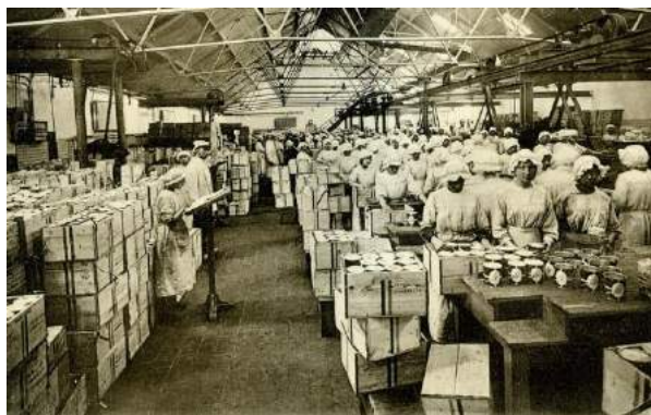
Inpakhal in de margarinefabriek van Jurgens, 1910.

Met eigen en vreemd vermogen breidden Jurgens en Van den Bergh hun activiteiten uit, kochten concurrerende bedrijven op en sloegen hun vleugels steeds meer uit richting andere Europese landen. Toen de Duitse rijkskanselier Otto von Bismarck eind jaren tachtig van de 19 e eeuw een importhelling op margarine oplegde, begon zowel Van den Bergh als Jurgens vlak over de Duitse grens zijn eerste buitenlandse fabriek. Er zouden er veel volgen.