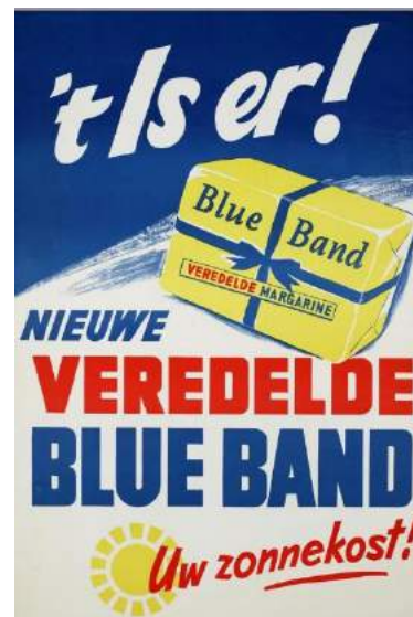
Reclame voor Blue Band in de jaren vijftig.

Met de komst van dat bedrijf leek het vertrek van Jurgens uit Oss aanstaande. In 1928 vertrokken de eerste onderdelen van de onderneming naar Rotterdam. Daarna ging het snel. Op 30 maart 1929 staakte Jurgens de laatste bedrijfsactiviteiten in Oss, waar op het laatst 800 man aan het werk waren. De ellende voor de arbeiders werd nog groter toen eind oktober een crash op de beurs van New York de wereld in een ongekende economische crisis stortte. Het droeg bij aan een nieuwe misdaadgolf, die van 'de Bende van Oss' en 'Osse messentrekkers' nationaal bekende begrippen maakte.