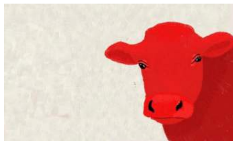
Illustratie Leonieke Fontijn Blösch: Beat Strechl

LEG EEN PERZISCH TAPIJT NIET IN DE KELDER ALS JE IN EEN WATERRISICOGEBIED WOONT!