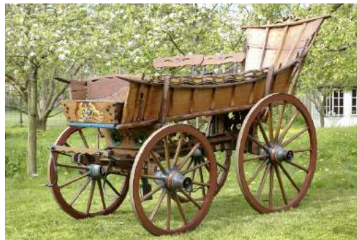
Twee Zuid-Hollandse boerenwagens.

Voor begrafenissen werd de boerenwagen veranderd in een plechtige rouwwagen. De wagen en ook de paarden werden zwart gemaakt door er zwarte kleden overheen te hangen. Vroeger had de kleur zwart een heel andere betekenis dan tegenwoordig. Als je terugkwam van een begrafenis en de stal in wilde rijden, dan konden de demonen of de duivel de weg niet vinden als alles zwart was. Zo kon men de demonen buiten de deur te houden. Later, ergens in de 19 e eeuw, heeft men kleur zwart tot kleur van de rouw bestempeld.