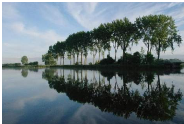
De 'ijle populieren', zoals Marsman ze bij zijn gedicht in gedachten had.

Populieren zijn de bekende hoge, rechte en stijve bomen die ook in het gedicht van H. Marsman worden beschreven: "Denkend aan Holland zie ik brede rivieren traag door oneindig laagland gaan, rijen ondenkbaar ijle populieren als hoge pluimen aan den einder staan." Toch kent het geslacht populier een breed scala aan verschijningsvormen. Populieren spelen een belangrijke rol in het Nederlandse landschap en Populierenbossen hoeven niet saai en eentonig te zijn