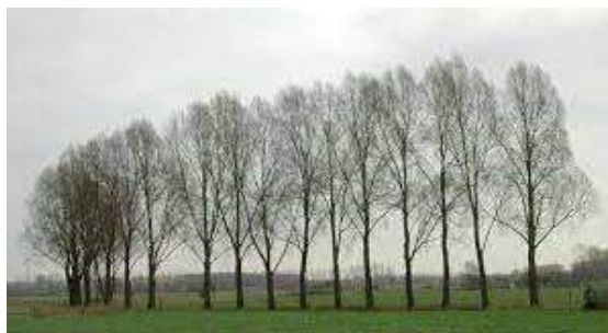
Een rij populieren in het landschap.

De populier - door velen verafschuwd en door een enkeling bewonderd. Vroeger was dat anders. 'Populieren, zij sparen en sieren' was toen de heersende mening. Met de sterke opkomst van natuurbehoud aan het eind van de jaren tachtig is dit veranderd. Het gevolg is dat de aanplant dramatisch is gedaald en de historische populierlandschappen snel verdwijnen.