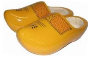
Links een solistisch geplante populier, in het midden gezaagd populierenhout, voor verdere verwerking of voor brandhout en rechts een paar geschilderde boerenklompen, gemaakt van populierenhout.