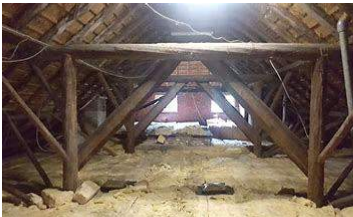
Een typische hooizolder, waar het houtskelet nog goed te zien is.

Het woord zolder stamt uit de Romeinse tijd, het solarium. Feitelijk was dat het platte dak van het gebouw, waarboven een doek werd gespannen om de mensen tegen de felle zon te beschermen. Feitelijk is de zolder dus niets anders dan de beschermende dakdelen.