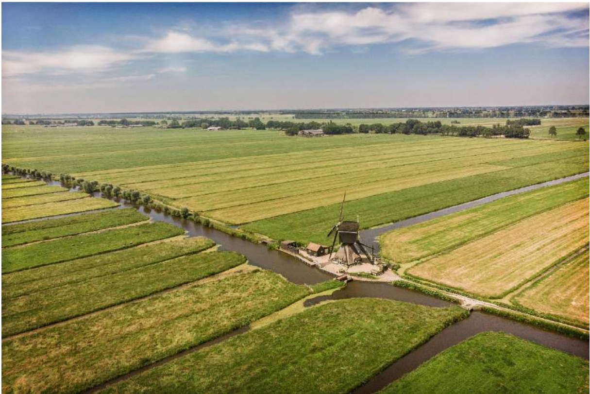
Luchtfoto van de Polder Giessendam, met de Tienwegsemolen (Arjen Hoftijzer).

Soms krijg je een foto onder ogen, waarop het patroon dat de sloten in ons weidelandschap vormen heel goed te zien is. Vooral bij luchtfoto's verbaas je je vaak over de kaarsrechte loop van deze waterafvoer. Ooit waren sloten pure noodzaak voor de afvoer van het vele (regen)water. In de huidige tijd hebben er zich perioden voorgedaan dat het relatief droog is en soms zo erg dat de weilanden niet meer groen zijn, maar geel.