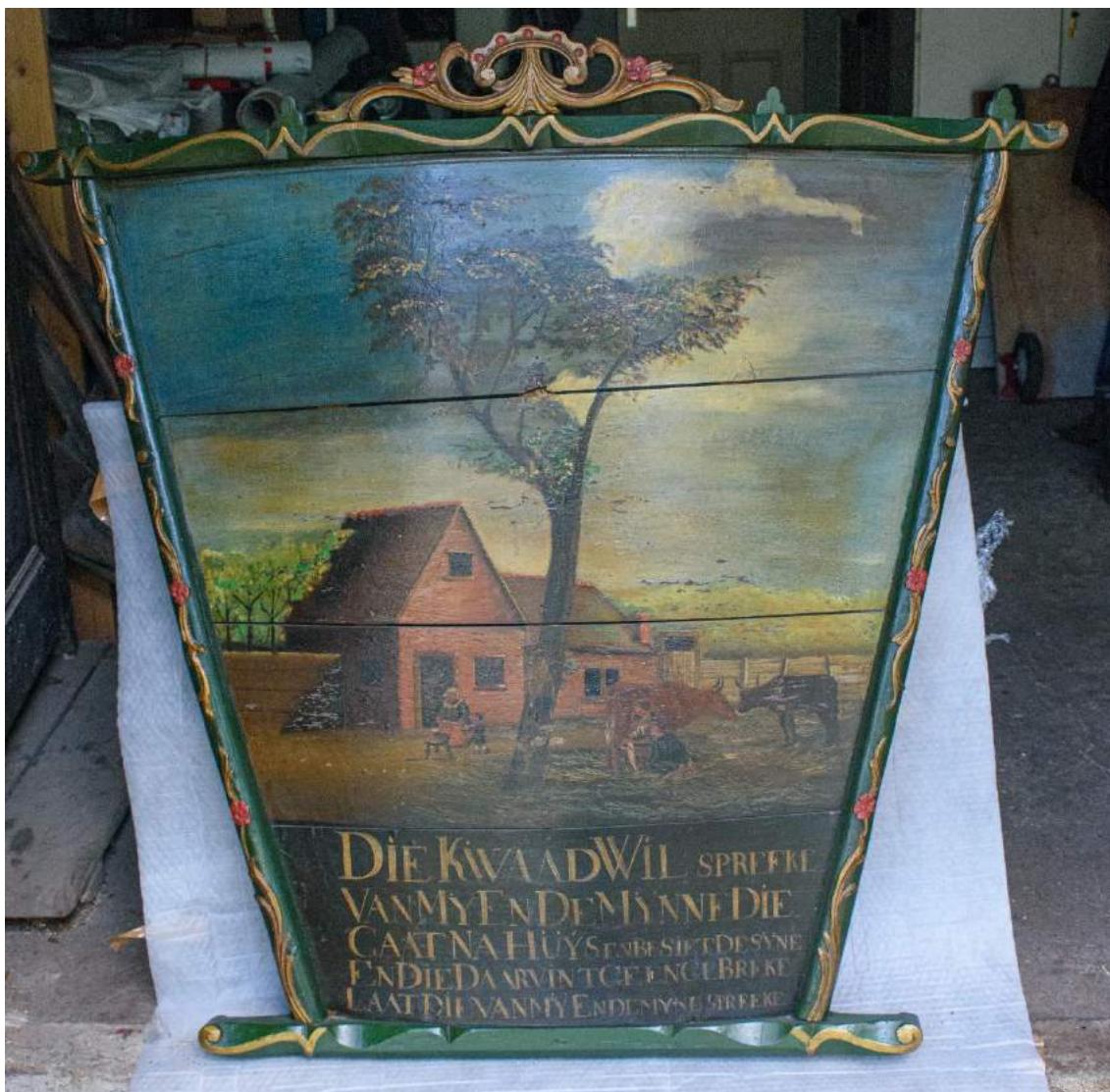
De beschilderde en van een spreuk voorziene schenking.

Aan de achterzijde van de boerenwagen bevindt zich de achterklep of het achterkrat. Deze kon onderaan draaien en door middel van kettingen in verschillende standen worden gezet. De bovenrand van de achterklep werd soms met houtsnijwerk versierd, het krat zelf werd soms beschilderd of van een spreuk voorzien.