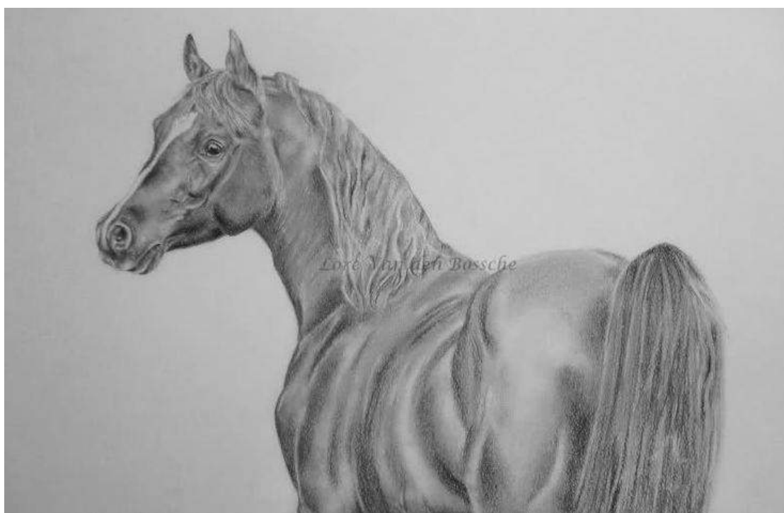
Wie heeft deze tekening gemaakt?

Tijdens de excursie hebben we overigens maar weinig paarden mogen zien; de enige die er waren liepen in de weilanden rondom het Gagelgat. Dat er niets in de stal stond, had ook te maken met het mooie weer. De enkele keer dat een vooraf aangekondigd buitje viel was toen we in de bus zaten.