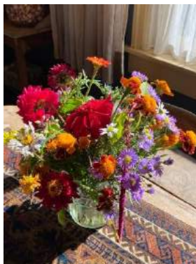
Boeket uit eigen tuin.