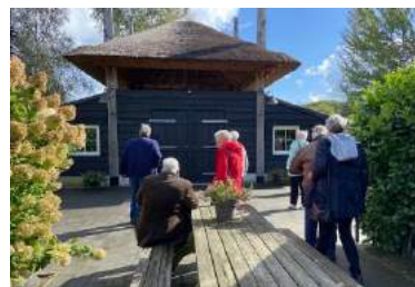
Theehuis De Leilinde.

De eerste stop was bij Theehuis De Leilinde. Ooit een boerderij, waarvan nu, op de contouren van wat er eertijds stond, een geriefelijke tuin, een eigentijds woonhuis en enkele als ontvangstruimte bestemde schuren te vinden zijn. De koffie of thee met wat lekkers ging er uiteraard goed in, waarna een formeel gedeelte, beter gezegd 'gedeelteje', volgde: een ledenvergadering. Daar ging het even over het afgeronde fotografeerproject, maar het belangrijkste wat hier werd besproken was een mogelijke bestemming voor een excursie volgend jaar. Zoals gebruikelijk werd van 'de rondvraag' geen gebruik gemaakt.