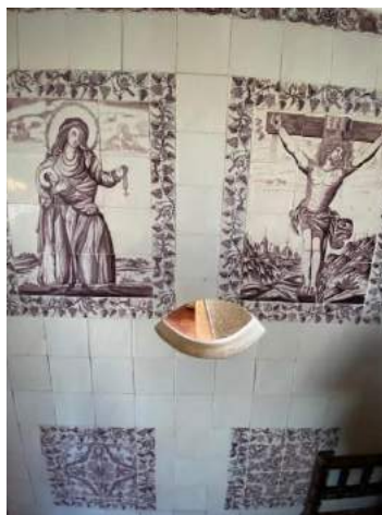
Een Roomse streek.