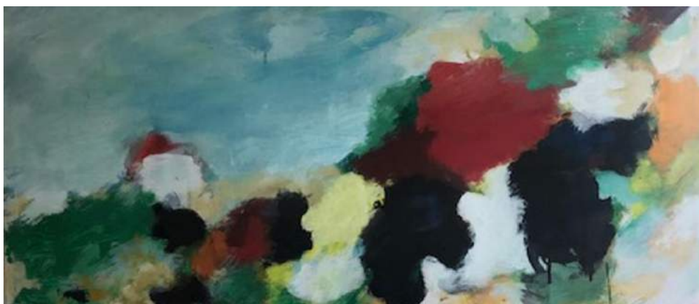
Een schilderij van een koe, Eugene Brands