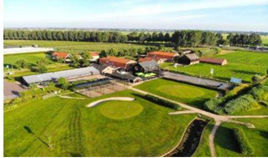
Herbestemming Maria Johanna Hoeve Noordeloos