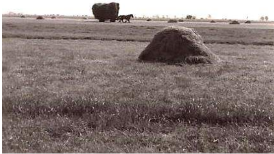
Hooien in de Giessendamse polder.

Met de zeis over de schouder naar het hooiland. Een stuk laaggelegen land wat vaak onder water loopt. Niet geschikt voor het vee, maar wel geschikt om hooi op te verbouwen. Dan het ritmisch suizen van de zeisen, naast elkaar: sssij sssij sssij. Af en toe de rode zakdoek uit de broekzak om het voorhoofd af te vegen. En weer verder, meter na meter. Moeder de vrouw die met de koffie naar het land komt; een welkome verschijning! 's Avonds doodmoe de zeis haren voor de volgende dag: tik tik tik!