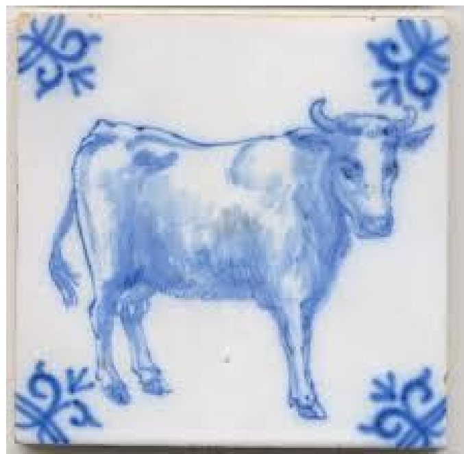
Een bijzonder koeientegeltje.

Elke actieve organisatie stelt zich wel eens de vraag: gaat het goed, zijn er verbeterpunten, vergeten we aandachtsvelden enzovoort. In dat voetlicht kwam de vraag naar voren of het toch niet efficiënter zou zijn om gewoon alles tot één organisatie terug te brengen. Het voornemen van de verenigingspenningmeester om zijn taken binnen Boerderij & Erf A-V te gaan beëindigen, heeft dit proces versneld. Een ingestelde uit bestuursleden van beide organisaties bestaande werkgroep kwam al snel tot de conclusie dat het veel simpeler zou zijn alles weer bij elkaar te voegen. Inmiddels zijn de leden van de vereniging hierover al gehoord. Dit heeft tot gevolg dat een en ander op de komende najaarsvergadering, die op 19 oktober 2013 zal worden gehouden, verder in uitvoering gaat worden genomen.