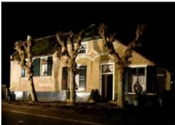
Herinnering aan een verlichte boerderijenroute.

Vrij kort nadat de stichting van start ging, is de Vereniging Vrienden van Boerderij & Erf A-V opgericht. Met subsidie van de provincie, want op deze manier zou er een kweekvijver ontstaan voor vrijwilligers en bestuursleden. Maar de belangrijkste beweegreden tot subsidietoekenning was vooral de hiermee te verkrijgen brede draagkracht voor Boerderij & Erf. Stichting en Vereniging bestonden naast elkaar en hadden dezelfde secretaris en penningmeester. Later kreeg de vereniging een eigen penningmeester, omdat de leden meer zicht wilden hebben op hun 'vermogen'. Een wat vreemde reden, want dat hadden ze ook gewoon aan de penningmeester van beide organisaties kunnen vragen, die die informatie overigens al jaarlijks verstreekte. Maar in feite vond hij die splitsing prima, want dat scheelde hem elk jaar een hoop werk.