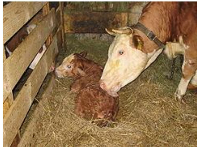
Een altijd weer vertederend beeld, zo'n zorgzame koe, die zich over haar kalf ontfermt.

Biest is bij rundvee krachtvoer voor het pasgeboren kalf. Bij koeien wordt colostrum biest en griest genoemd. Eigenlijk is het zo dat de eerste melk die een koe geeft griest wordt genoemd en de tweede melk biest.