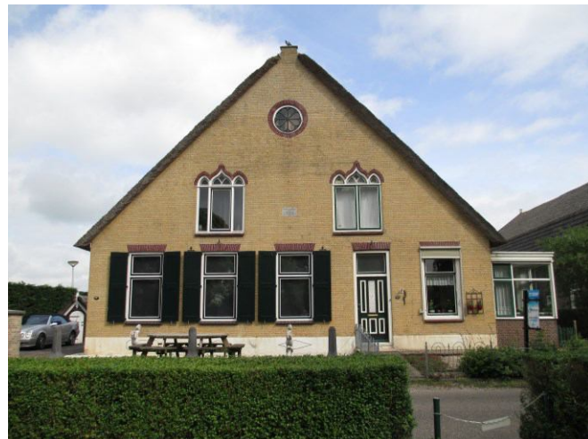
De bovenramen van deze boerderij uit Giessenburg zijn engelenramen; het linker is teruggebracht in originele staat.