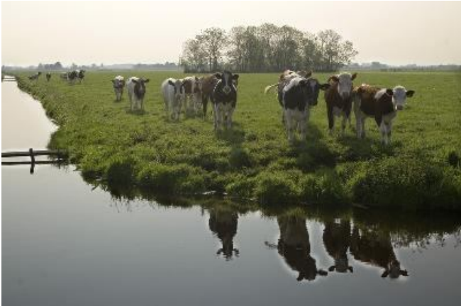
Koeien met op de achtergrond een pestbosje.

Echter veel pestbosjes in Zuid-Holland zijn niet goed onderhouden, terwijl ook de omringende sloot is verwaarloosd en de oever is afgekalfd. Daarnaast is bij veel mensen (bewoners én recreanten) weinig bekend over de oorsprong van de deels door mythen omgeven geriefhoutbosjes, hetgeen ook bijdraagt aan gebrek aan belangstelling voor herstel en onderhoud.