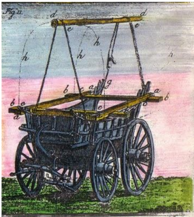
Tekening van het gebruik van een boerenwagen als hooiwagen. Uit: Natuurlijke historie van Holland van Johannes Francq le Berkhey.

Dezelfde bron vermeldt dat men ook het onderstel van de wagen waarop de voor- en achterschotten rusten, wel krat noemde. Van Berkhey schrijft: 'De kratten der wagen volgen den draai van den disselboom, op de kratten der wagen staan aan weerszijden twee staken, waardoor aan elke zijde een plank geschoord wordt... Op de tekening is het achterkrat neergelaten. Dat gebeurde om het hooi betere te kunnen laden. Als dat namelijk achter vandaan gebeurt kun je beter in de gaten houden dat de last op de wagen goed wordt verdeeld en in evenwicht blijft.