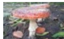
De zuurkooltijd begint als deze paddenstoelen groeien.

Als er geen deksel is voldoet een stevige schone theedoek ook. Wel dicht-