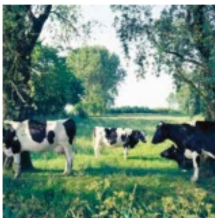
Je zou zo'n uitzicht hebben vanuit je voormalige boerderij...

Van oorsprong bestond een boerenbedrijf uit een groot stuk grond, met daarop aan de voorkant de boerderij. Dat stuk grond, verdeeld in weilanden, zal veelal niet meer bij de boerderij behoren als deze een herbestemming heeft gekregen. Maar het ligt er vaak nog wel. Als het enigszins kan, is het aan te bevelen dat het zicht op dat weiland vanuit de boerderij in stand wordt gehouden. Dat geeft een ruimtewerking, die het woongenot beslist ten goede komt. Ruimte verveelt nooit! Daarmee komen we op enkele thans actuele discussies. Steeds minder lopen er in dat weiland koeien. Een bekende melkproducent maakt reclame met het feit dat zijn melk