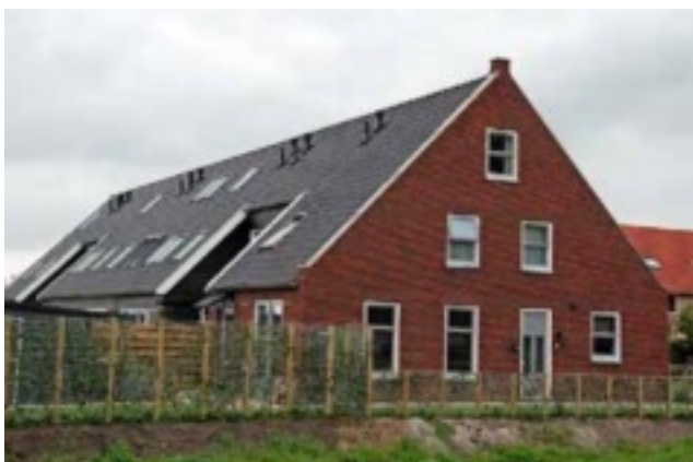
Nieuwbouwwoningen in Wijngaarden, in de vorm van een boerderij.