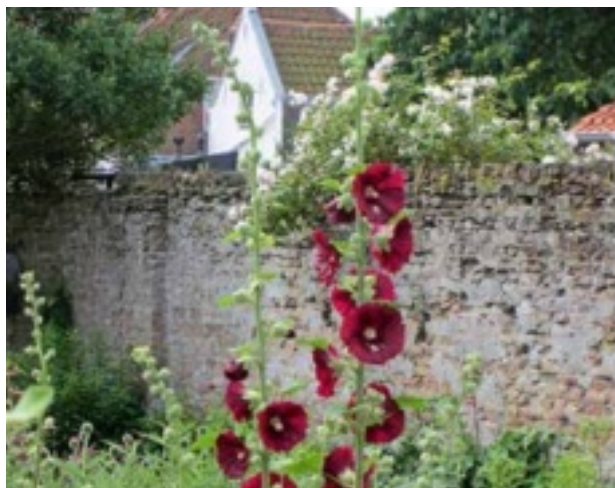
Stokrozen blijven mooi.

En dan nog dit: Stokrozen zijn gevoelig voor roest, die heel moeilijk te bestrijden is. Het best haal je alle aangetaste delen onmiddellijk weg. Gooi ze in de vuilnisbak, niet bij het compost. Je kunt dit euvel wel tot een minimum beperken door te kiezen