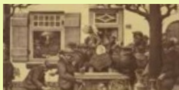
Tekening van een erfhuys.