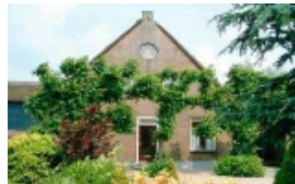
Bomen voor de boerderij.

zijn de verschillen groot. Want bomen groeien niet overal even goed. Op de Veluwe (zandgrond en droog) groeien dennen goed. Op de kleigronden die vochtig en voedzaam zijn groeien bijna alle soorten bomen goed. Sommige soorten bomen houden van natte voeten, zoals wilgen en berken. Op enkele specifieke plaatsen kan de krachtige zeewind er oorzaak van zijn dat maar enkele soorten kunnen groeien en dan nog met veel moeite (aan de Noordzeekust bijvoorbeeld). Zo ontstaan streekgebonden variaties en combinaties door functionele of lokale omstandigheden.