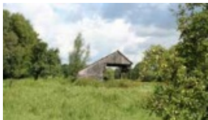
Ook dit is beeldbepalend.

Het al genoemde inventariseren heeft een meerledig doel. Ook voor het in beeld krijgen welke panden er een beschermde status hebben en welke daar in overleg met de regionale overheden nog aan toe gevoegd zouden moeten worden. Dit kan pas aanvangen als de inventarisgegevens verder gecompleteerd zijn.