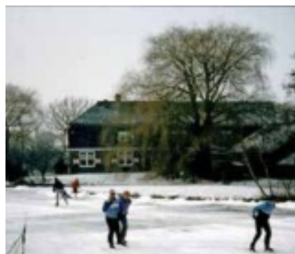
Ijstijd is koek- en zopietijd.