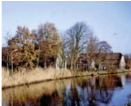
Maar ook als er geen ijs ligt is een zopie lekker.

Interessant is het om te weten waar dit ijsvermaak van afstamt. Ten tijde van de Republiek van de Zeven Provinciën waren er allerlei strenge wetten uitgevaardigd, gebaseerd op de toentertijd als streng ervaren gereformeerde geloofsleer. Carnaval, Sint Maarten en Sinterklaas werden afgeschaft, want dat waren paapse dwaalingen. Maar het nieuwe juk, waarbij weinig of niets mocht, knelde. Elke bestuurder in die tijd realiseerde zich dat een mens van tijd tot tijd wat ple-