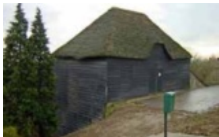
Dijkmagazijn langs de Lek met links twee naaldbomen

voerplaats van onderzoeksmateriaal. De opkomst van de tuinarchitectuur maakte de kweek van 'speciale' bomen interessant. In de vorige eeuw zijn veel boomkwekers met de nieuwe soorten aan de slag gegaan en ontstonden door 'kruisingen' ervan de gekweekte variëteiten. Intussen waren speciale regels ontwikkeld om de namen van alle soorten bomen over heel de wereld specifiek te maken. In het 'Latijn' staan die namen overal voor dezelfde soort. Als je een kerstboom op internet bestelt wil je geen 'dennenboom' thuis krijgen toch!