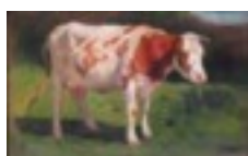
Zomaar een geschildeerde koe.

Gelukkig hebben wij als Boerderij & Erf hier destijds maatregelen voor genomen, een visie ontwikkeld en kunnen we nu adequaat optreden. Maar