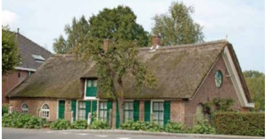
Boom voor een boerderij.

De groene bladeren produceren met behulp van zonlicht energie uit water en CO 2 . Daarbij komt zuurstof vrij waar alle levende wezens gebruik van maken. Ook halen bomen veel fijnstof weg uit de lucht.