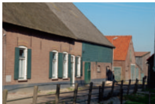
Hoe zag het erf er uit?