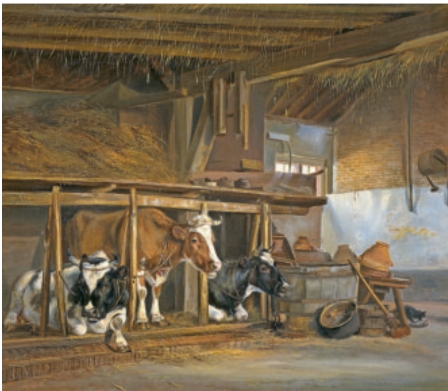
Schilderij met koeien op stal.

Ook u kunt ons helpen door in uw verkiezingsprogramma aandacht te vragen voor de boerderijen en de andere landelijke bebouwing in uw gemeente. In de loop van 2013 gaan wij de gemeentebesturen benaderen om ons meedenken en adviseren in de praktijk te brengen.