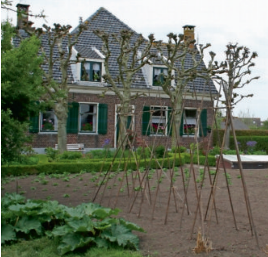
Voorjaar in een moestuin in Graafland.

over dat onderwerp. Het streekcentrum is overigens een bezoek meer dan waard. Ook in groepsverband of bijvoorbeeld voor een kinderfeestje kunt u er terecht. Beslist aan te bevelen.