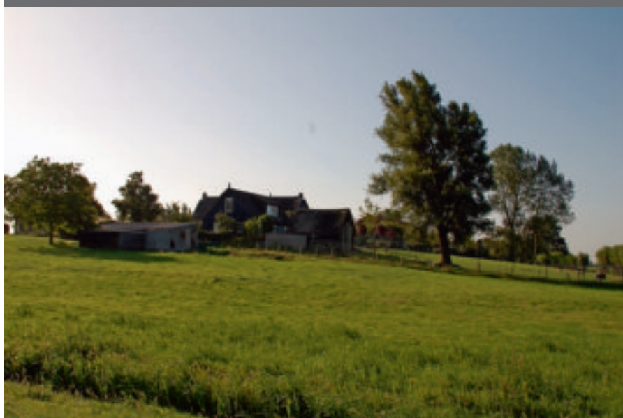
Den Donk in Brandwijk.