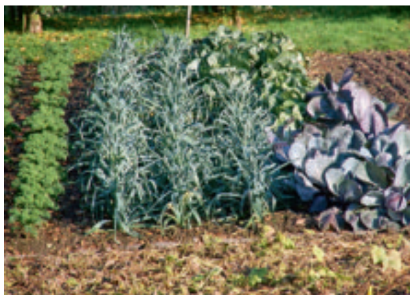
Alles keurig op een rijtje.

Maak vervolgens een plattegrondje van de oude situatie waar - op schaal - alle aanwezige gebouwtjes en de oude beeldbepalende beplanting (bomen en hagen) worden aangegeven. Ook looproutes en rijpaden moeten hierbij duidelijk worden aangegeven.