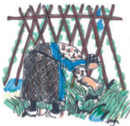
Oogsten (tekening Maja Philips).

Elke tuin heeft iets met zijn directe omgeving. Dat is niet anders met de boerentuin in de Alblasserwaard en de Vijfheerenlanden. Daar zijn onmis-