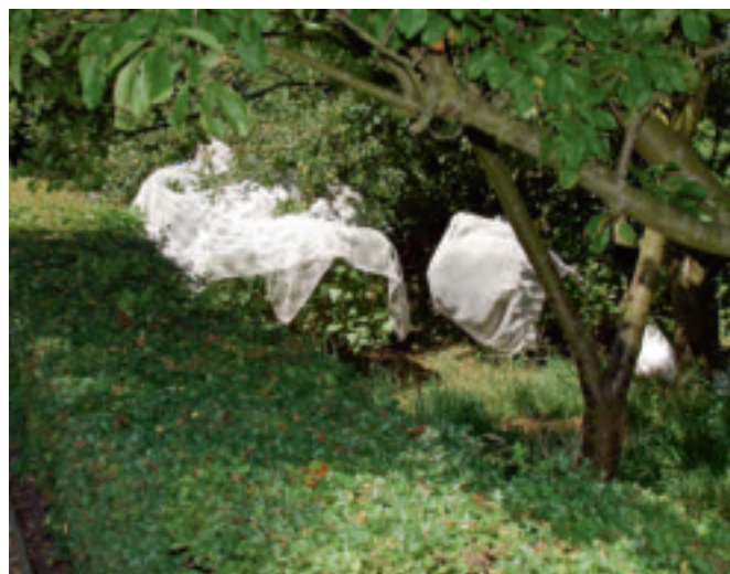
Met een oud gordijn beschermde bessenstruiken.