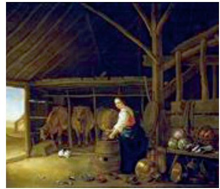
Stalinterieur van Aelbert Cuijp.

Veel stallen hebben iets met licht. Zelfs als er nauwelijks sprake is van lichtinval, is er toch sprake van een bepaalde sfeer. Iets feeërieks haast. Iedereen die in de jaren zestig wel eens op een boerderij kwam zal dat moeten erkennen.