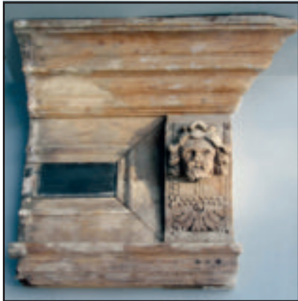
Fragment van de schouwlijst.

Bij de sloop van Boerderij Gijbeland was de vondst van een klein deel van een schouwlijst heel verrassend.