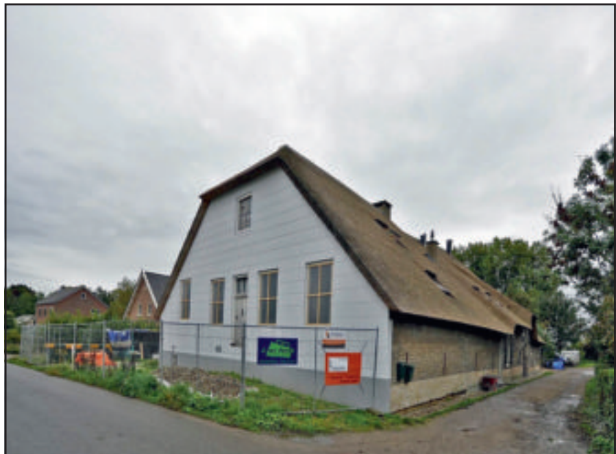
In Molenaarsgraaf is de restauratie van Graafdijk-Oost 16 nog in volle gang.