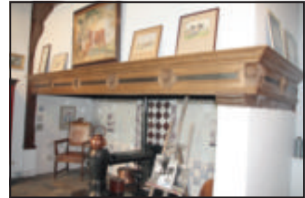
Schouw met nieuwe lijst

het masker (kopje), een kraag die tussen 1630 en 1660 in de mode was. De molensteenkragen die de personen op dit schilderij dragen, waren iets vroeger in de mode.