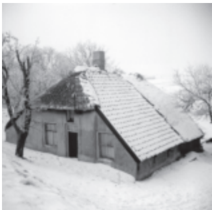
Oude foto's uit een vervlogen winter in het oosten van ons gebied.