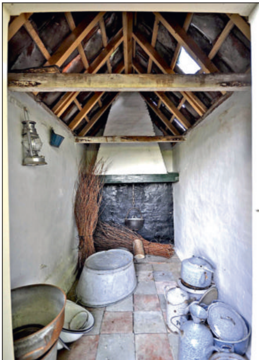
Ook stookhuisjes hebben een interieur.

Of de aangekondigde Algemene Maatregel van Bestuur er ook daadwerkelijk komt is nog niet duidelijk. Er is ook nog het Verdrag van Granada uit 1994, waarin de nadrukkelijke afspraak is gemaakt dat juist ook de interieurs van beschermde monumenten onder deze beschermingsstatus vallen. Daarom schrijft dit verdrag juist passende goedkeurings- en controleprocedures voor. Omdat bij meer dan 80% van de geregistreerde monumenten helemaal niet is vastgelegd wat voor interieur er in te vinden is, zullen we ook nooit te weten komen, wat er verloren gaat. Ook een manier om je geweten te sussen.