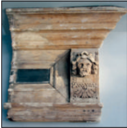
Fragment van de schouwlijst.

Bij de sloop van Boerderij Gijbeland was de vondst van een klein deel van een schouwlijst heel verrassend.