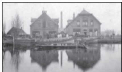
Melkvarren in de Waard (foto uit collectie Historische Vereniging Binnenwaard).