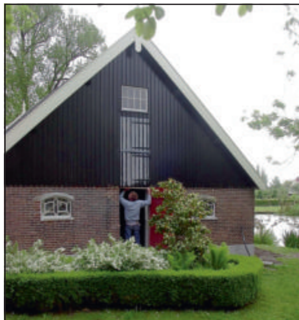
De oude varkensschuur Slingelandseweg 52 te Giessenburg.

De eervolle vermeldingen gingen naar de familie Baan (Het Hoge Huis in Brandwijk – restauratie stookhuisje) en Waterschap Rivierenland te Tiel (vervanging landschappelijk passende bruggen in de Wijngaardsesteeg en de Minkelose Heul).