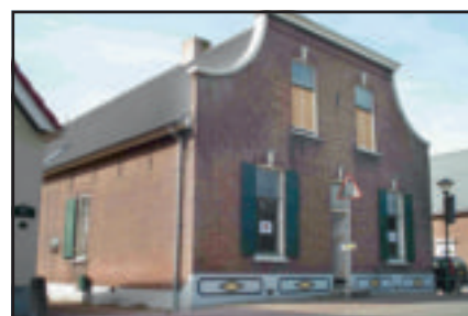
De boerderij in het centrum van Hoogblokland