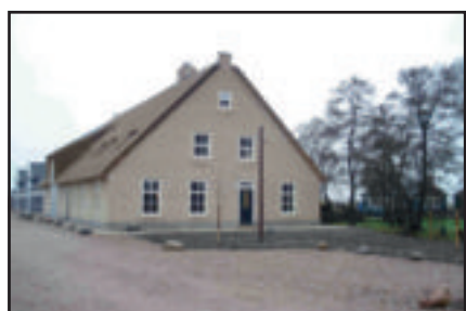
Terwijl De Schaapskooi er buiten verlaten bij ligt, zorgen de schapen binnen voor veel drukte.

Het voorhuis wordt woonruimte en op de bovenverdieping zijn vier gastenverblijven die kunnen worden gehuurd. Huug noemt het geen bed & breakfast maar een sheperd inn. Wilt u meer informatie over de mogelijkheden van de Schaapskooi Ottoland: www.schaapskooiottoland.nl .