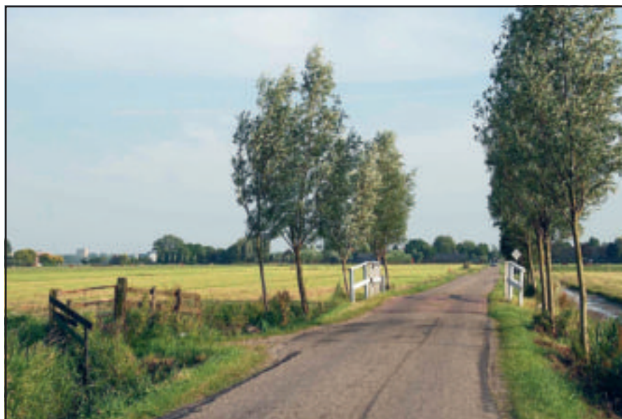
Voor het opknappen van onder andere dit brugje kreeg het Waterschap een eervolle vermelding.