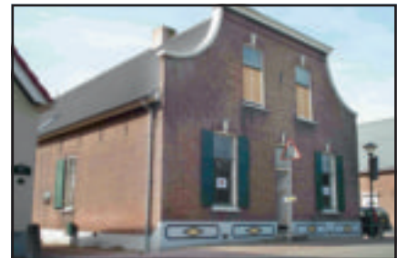
De boerderij in het centrum van Hoogblokland