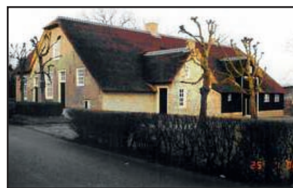
De afgebrande boerderij Binnendams 26.

Ooit was Giessendam een rijk boerendorp, waar de hofsteden aan elkaar grensden. Helaas resteren er daar nog maar een paar van en heeft de rest het veld moeten ruimen voor nieuwbouw. Vaak kapitale villa's, die echter niet in de schaduw kunnen staan van die prachtige boerderijen van weleer.