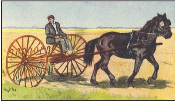
Het paard in bedrijf (tekening van Jaad Veenendaal).

Hoewel het in onze beeldvorming al wel enkele eeuwen geweest zal zijn dat de boeren een paard gebruikten