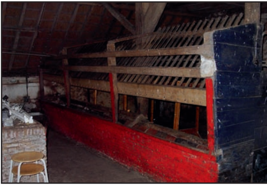
Paardenstal langs de Diefdijk onder Leerdam. Duidelijk te zien zijn is de krib met rode en blauwe plavuizen met daarboven de ruif. De klep voor de krib ontbreekt.

Een enkele keer komen we in oude boerderijen in de Alblasserwaard en de Vijfheerenlanden nog wel eens de paardenstallen of de restanten daarvan tegen. Vóór de mechanisatie in de landbouw was de boer voor het vervoer aangewezen op vervoer over water of vervoer met paard en wagen.