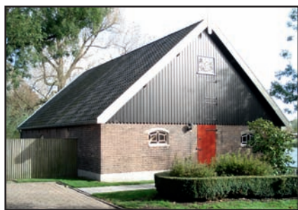
De varkensschuur Slingelandseweg 52.