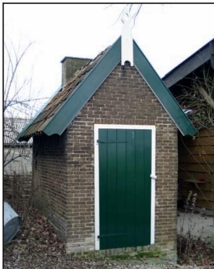
Het stookhuisje naast het Brandwijkse Hooge Huis.

Stookhuisjes, zijn kleine huisjes, die eind 19 e en begin 20 e eeuw werden gebouwd toen de melkveehouderij en de kaasmakerij werden uitgebreid. Daarbij was veel warm water nodig voor de 'wringery', het maken van de kaas en dit water werd in zo'n stookhuisje warm gemaakt.