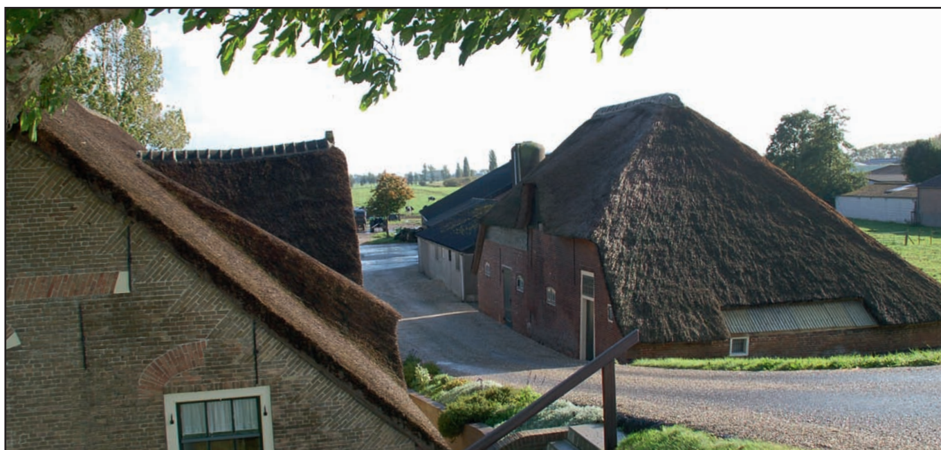
Tienhoven, waar de boerderijen opnieuw gevaar lopen vanwege de volgende dijkverzwaring in successie.