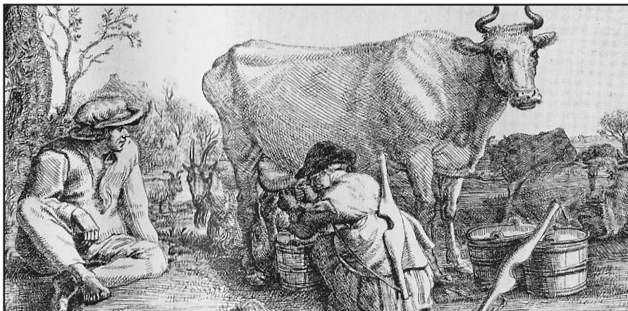
Opnieuw de melkmeid.

Een hut wordt pas een huis genoemd als er sprake is van een echte draagconstructie. Het woord huis komt via het Germaans van het Indo-Europese kuhs, dat eveneens van huid stamt. De boerderijtypen in onze streek worden hallehuis genoemd. Waar het tweede deel van dit woord vandaan komt is intussen duidelijk. Het eerste deel, hal, komt van - grote - overdekte ruimte of opslagruimte. Stallen is weer afgeleid van staan. Een stal is letterlijk een plek om te staan. Het woord boerderij komt overigens pas rond 1800 officieel in gebruik. Voordien bestond het al wel, maar dan alleen in de spreektaal. Zoals in een eerdere editie van de nieuwsbrief staat beschreven komt dit van boer, zoals bakkerij van de bakker komt en smederij van de smid.