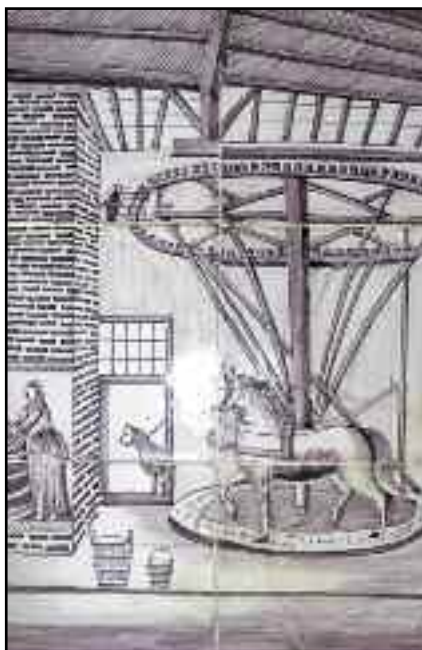
Tegeltableau met karnmolen