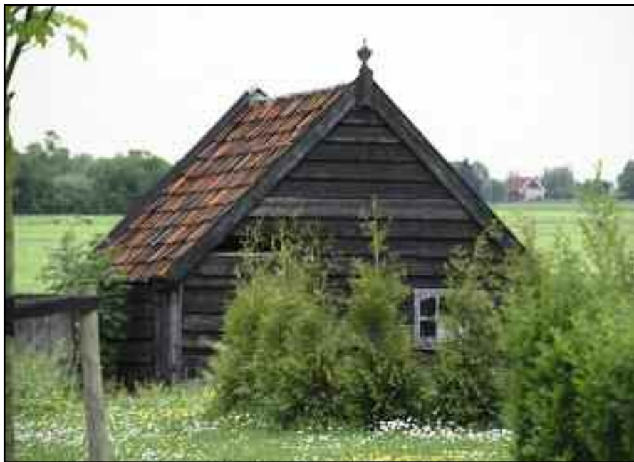
Ook dit is cultureel erfgoed