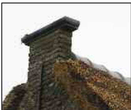
Mannetje of wachter

Een boog aan de morgen Baart de landman zorgen Ziet hij de boog tegen de nacht Hij schoon weer verwacht