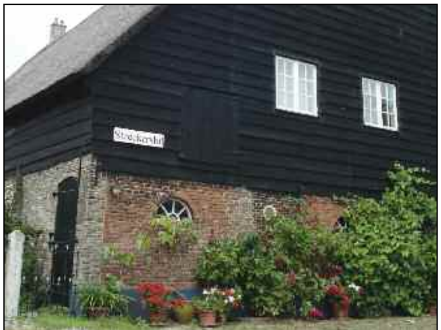
Steeckershil vanaf de weg