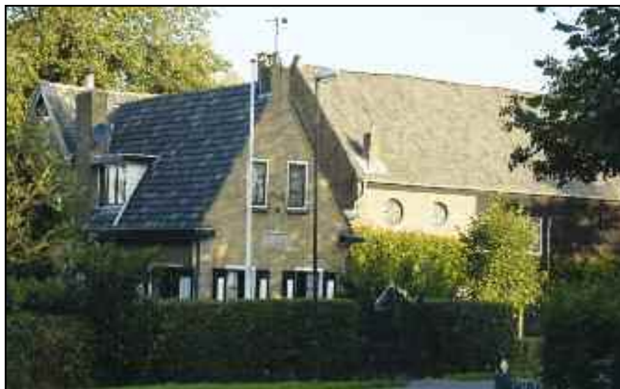
Boerderij 'De verkeerde wereld' in Giessen-Oudekerk