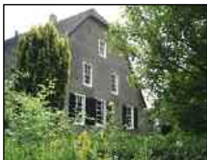
Steeckershil vanaf de Alblas gezien

Tussen kasteel en boerderij, op een heuveltje of hil, staat in die tijd een versterkte toren. Dat is een teken van de bloei die het platteland dan doormaakt. De bewoners laten daarmee hun welvaart zien maar het dient ook voor hun veiligheid. De toren is namelijk ook voorzien van schietleuven voor pijl en boog.