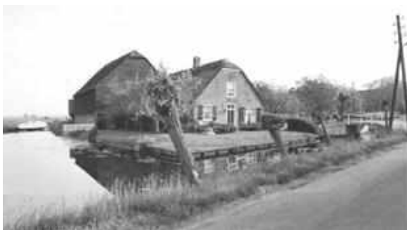
Midden 19 e eeuwse boerderij met hoge houten schuur op stenen voet aan de Benedenheul 27.

Die schuren vormen een markant verschijnsel in de Krimpenerwaard. Zij komen vooral in de omgeving van Tussenlanen, Bovenberg, het Beijersche en de Achterbroek voor. Zij zijn grotendeels van hout en staan op een stenen voet. Aan de lage kant, waar het vee staat, zien met nog wel geheel stenen muren met mestluiken. Deze twee- of eenbeukige schuren hebben een dwarsgelegen deel, herkenbaar aan de hoge deuren in de zijgevel. Evenwijdig met de boerderij