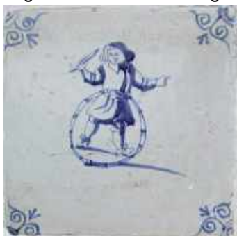
Een willekeurige antieke tegel.

Intussen zijn we twee bezoeken van deskudigen verder en hebben we de cijfers van de continu uitgevoerde klimaatmetingen aan de onderzoekers ter beschikking gesteld. Er zijn boringen