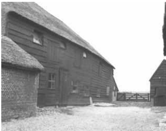
Houten dwarsdeelschuur met hooiluiken op de verdieping achter de boerderij Benedenberg 105 (1978).

In het zuidelijk deel van de Krimpenerwaard komen vooral langs de rivier de Lek enkele dwarsdeelboerderijen voor (Opperduit 258, 352, 360). In het midden van de waard zijn dit Achterbroek 115 en Bovenberg 82. Bij deze boerderijen ligt de inrit tot het bedrijfsgedeelte, herkenbaar aan de hoge deeldeuren, in een van de zijgevels aan de kant van de oprit. De hooiwagens kunnen zo direct van de oprit de schuur indraaien. In het inwendige staat het vee langs de andere zijgevel en de achtergevel. Het hooi werd op de balken boven de midden- en zijbeuk getast.