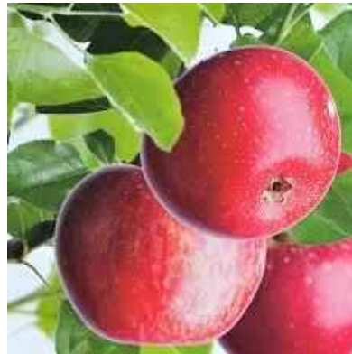
Sterappels zouden rond de stam van de boom in het maanlicht moeten verder rijpen om nog mooier rood te worden...

Overal in de Alblasserwaard-Vijfheerenlanden zijn wel fruitbomen bij de boerderijen te vinden. In minder of groter getale. Soms een verwaald lijkende boom, elders staan ze keurig in een rij. Dat wil zeggen op gelijke afstand van elkaar in rechte rijen. Ooit was de noordelijke Giessendijk van de Peursumse Vliet in Giessen-Nieuwkerk tot aan de Sliedrechtse Kaai aan de buitenkant bebouwd met louter boerderijen. Ze stonden daar 'huis ter om op'. En vanaf de dijk kon je al zien of en wat voor boomgaard erbij hoorde. Bij een glad erf zag je een mooie boomgaard.