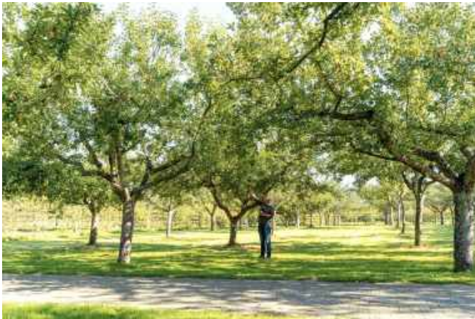
Een willekeurige boomgaard.