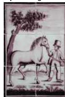
Deze tegels zitten niet in de beschreven schouw.