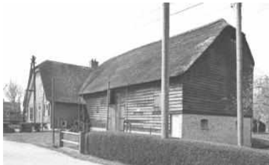
Het complex met de dwars aangebouwde tweebeukige schuur aan de Achterbroek 47 (foto RDMZ, 1994).