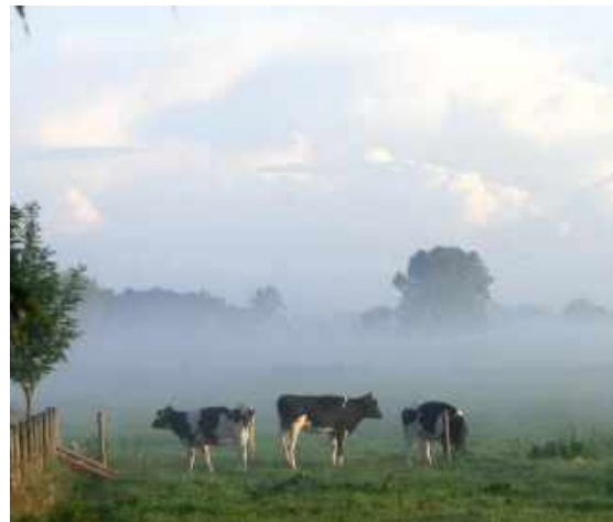
Foto van Wim van der Ham, eertijds ingebracht voor de wedstrijd Denkend aan Holland

Vanmorgen dook de mist op uit de sloten het water dampte strooksgewijs omhoog andere, nu witte vlagen dreven over 't land een enkele koe keek moedeloos in 't rond