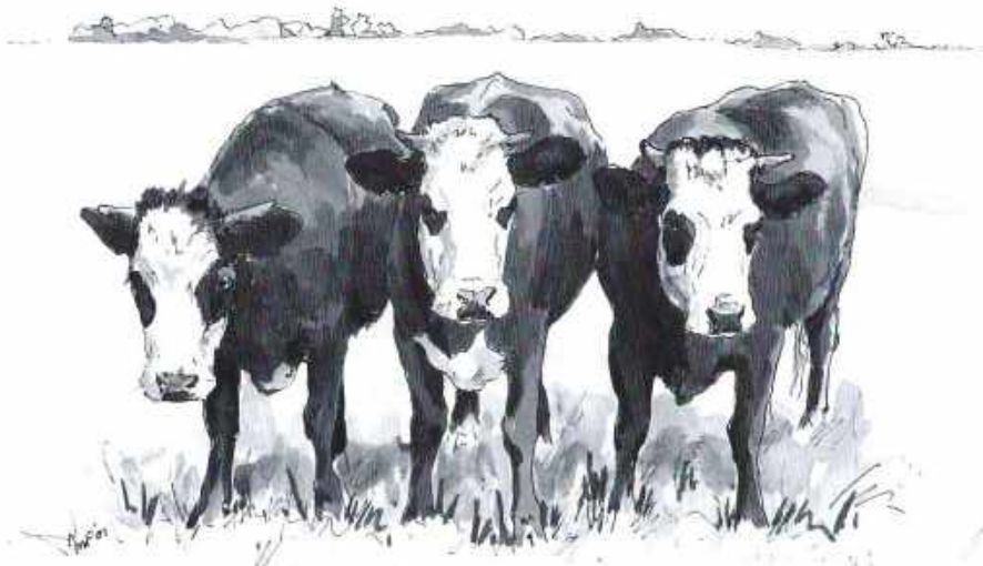
Aquarel van Zwanet Faber: Blaarkoppinken op De Har in 1974. V.l.n.r.: Martha 28, Rudie 17 en Gerda 17.

De Groninger blaarkop is een echt dubbeldoelrund, geschikt voor melk- én vleesproductie. Ze scoort goed op kwaliteiten zoals vruchtbaarheid en zijn makkelijk met afkalven, ze zijn duurzaam, sober, robuust en gezond, daarnaast hebben ze een rustig en aanhankelijk karakter. Blaarkoppen leveren behalve vlees van hoge kwaliteit, ook melk met een goed eiwitgehalte wat zeer bruikbaar is voor kaasproductie.