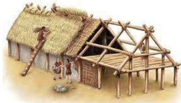
Mooi is op deze tekening te zien hoe de eerste boerderijen werden gebouwd.

uitzonderlijk rijk verruimd. De plantaardige productie was in de Romeinse tijd al in gang gezet. De Romeinen kenden naast graanteelt echter ook een omvangrijke en gevarieerde groenteteelt. Ook bezaten ze al boomgaarden voor fruit.