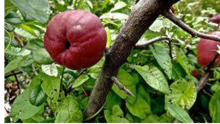
Een wilde appelsoort.

dat de akkerbouwende boeren op pad gingen om bijvoorbeeld hazelnoten te plukken en kersen, wilde appels, pruimen, rozenbottels, bessen en bramen. Al die vruchten kwamen in die tijd in het wild voor. Daarnaast hielden ze schapen en geiten, varkens en koeien.