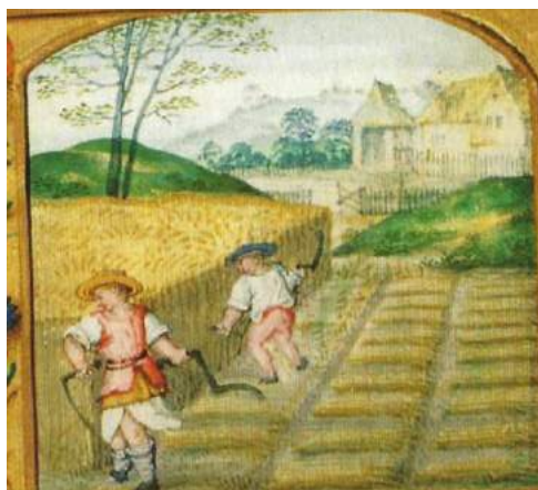
Tekening van middeleeuwse graanteelt.

Dat die voedselvoorziening er toentertijd mocht wezen blijkt uit opgravingen van nederzettingen uit de Romeinse tijd. Het inpotten om het voedsel langer te kunnen bewaren was toen al heel gebruikelijk. Hieruit blijkt dat in het huidige Nederland toen al veel rundvlees werd gegeten (met bot meegeteld ongeveer een kilo per persoon per dag). Maar ook geïmporteerde olijven, druiven en vijgen. Rond Nijmegen heeft men gezouten Spaanse makreel gevonden. Aangenomen wordt dat de toenmalige elite de (eet)gewoonten van de Romeinen over heeft genomen.