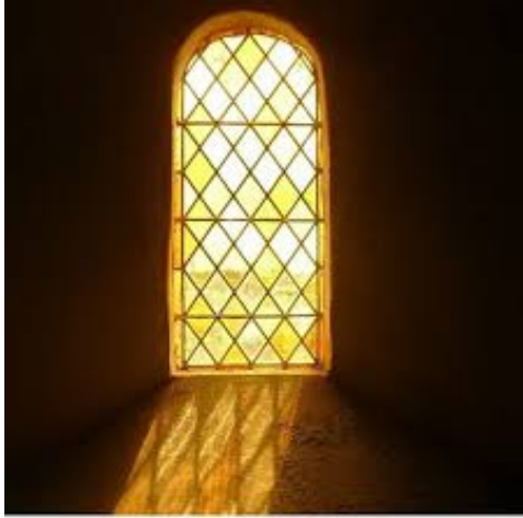
In dit oude kerkraam zijn de ruiten nog goed te herkennen.

Het eerste glas dat wij kennen was het zogenaamde geslingerd glas. Dat had de ronde vorm van een voet van een wijnglas. Door een aantal van die ronde glasstukken in lood te zetten kon met een grotere raamopening overspannen. De kleine stukken glas werden dus bijeen gehouden door loodstrippen. Men was in de middeleeuwen eenvoudigweg niet in staat om grotere stukken glas te maken. Maar de kennis nam toe en de glasmakers lukten het om steeds grotere stukken glas te vervaardigen, weliswaar met andere methoden. Omwille van de stevigheid bleef men echter kleine stukken gebruiken. Om daarbij zo weinig mogelijk glas te verliezen sneed men uit de glasplaatjes ruitvormige stukjes glas. Die ruitjes waren ongeveer 8 x 12 cm groot. Vanwege de vorm werden die ruiten genoemd. Mogelijk houdt dat verband met de vorm van het blad van de plant de wijnruit.