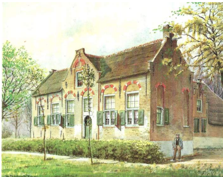
Boerderij aan de Bovenbergscheweg in Bergambacht, geaquarelleerd door J. Verheul Dzn.

Er is een nieuwe voorzitter en we hebben eens op een rijtje gezet wat we in de tijd van ons bestaan onder meer hebben gedaan. Meer daarover leest u in deze een volgende nieuwsbrief. Nieuw is een column van Henk Bovekerk. Van harte aanbevolen.