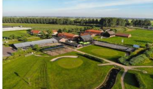
Herbestemming Maria Johanna Hoeve Noordeloos