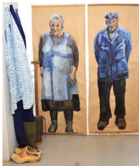
Detail uit de expositie 'Denkend aan Holland'.