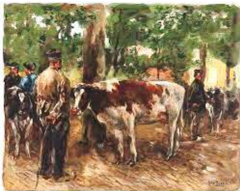
Willem de Zwart: veemarkt te Laren

Ook de op een markt aanwezige ontspanningsmogelijkheden waren belangrijk. Er waren ook muzikanten, vertellers en artiesten nodig om veel volk op de been te brengen. Jaarmarkten waren sociale evenementen. Bij uitstek het moment om te feesten, een pint te drinken en het andere geslacht te ontmoeten.