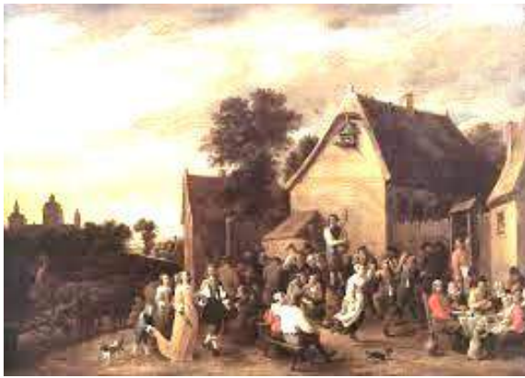
Middeleeuwse markt (onbekend schilderij).

Het leeuwendeel van de bevolking leefde op het platteland. Steden waren veeleer kleinschalig en bewoningscentra bevonden zich op relatief grote afstand van elkaar.