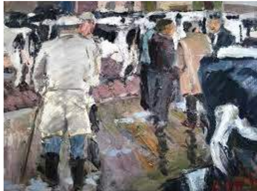
Schilderij van Ruud Spil

Vanaf de achttiende eeuw verloren heel wat jaarmarkten hun dominante rol, dat tijdens de industriële negentiende eeuw nog versnelde. Een eeuw waarin spoorwegen en stoomschepen het transport sneller en goedkoper maakten en er betere communicatiemogelijkheden kwamen. Daarnaast nam het aantal weekmarkten en winkels toe, ook op het platteland, en groeide de handel in vee uit tot een continue, dagelijkse bedrijvigheid. De veestapel nam vanaf de jaren 1880-1890 in sterke mate toe en een aanzienlijk deel van de koop en verkoop van vee werd overgenomen door veehandelaars en kooplieden, die al snel een sleutelfunctie innamen.