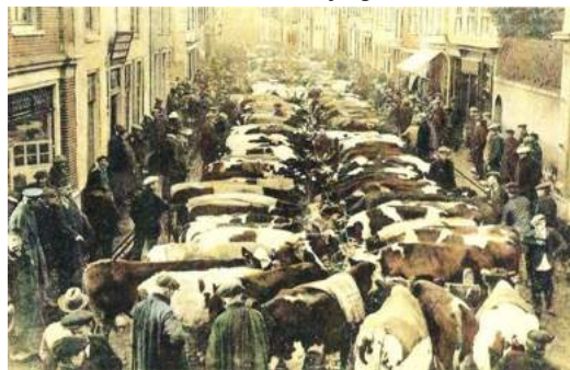
De Gorcumse veemarkt in de Haarstraat.

Sommige jaarmarkten genoten in de middeleeuwen en vooral later een bovenlokale reputatie. Tijdens de jaarmarkten wisselden niet alleen levensmiddelen en huishoudartikelen van eigenaar. Ook dieren en vee werden er verhandeld. Net zoals nu waren de dieren waarschijnlijk ook al in de voorbije eeuwen een publiekstrekker. Mensen kwamen zich graag vergapen aan indrukwekkende stieren, veelbelovende kalveren en vette varkens, getuige ook de vele etsen en schilderijen van markttaferelen. Diezelfde dieren werden ook verhandeld in de steden of centrumplaatsen. De veemarkten zorgden niet alleen voor heel wat bedrijvigheid in de stad, maar ook voor overlast omdat slachters en beenhouwers hun activiteiten midden in het centrum ontpleiden. Het vee moest door de soms smalle straten naar een centraal plein, de eigenlijke veemarkt worden geleid. Daarnaast was er ook veel lawaai- en geurhinder. In de zestiende en vooral de zeventiende eeuw werd de functie van de markt wat minder omdat er veel meer dan voorheen onderling werd