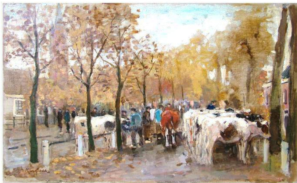
E.A. Langeveld: Veemarkt te Laren.

Een aantal jaarmarkten bleef toch bestaan en verstevigde haar positie. Op sommige plaatsen kreeg de veemarkt zelfs meer aandacht. Dat had vooral te maken met een aantal algemene landbouweconomische ontwikkelingen. In de Alblasserwaard en de Vijfheerenlanden moesten vanaf 1870/80 de boeren door de ontwikkelingen in hun branche op zoek naar meer rendabele activiteiten. In een tijd van twintig á dertig jaar ontpopte de veeteelt zich tot een belangrijke economische bezigheid. Het in die tijd opgerichte ministerie van Landbouw wilde de veeteelt op een moderne manier organiseren op het gebied van hygiëne, veevoeding en rasveredeling. De weekmarkten en de bijbehorende prijskampen waren hiervoor zeer geschikt.