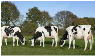
◀ 1.621 Fries-Holland zwartbont