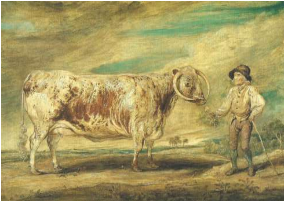
Schilderij van een onbekende schilder van Lord Anson of Shugborough, met een 'langhoornkoe'.