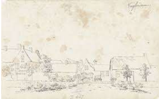
Links een tekening van Vuilendam.

Officieel staat het als volgt beschreven: 'Vuilendam is een buurtschap in de provincie Zuid-Holland, in de streek Alblasserwaard, gemeente Molenwaard. Tot en met 1985 deels gemeente Brandwijk, deels gemeente Molenaarsgraaf, deels gemeente Ottoland. In 1986 over naar gemeente Graafstroom, in 2013 over naar gemeente Molenwaard'.