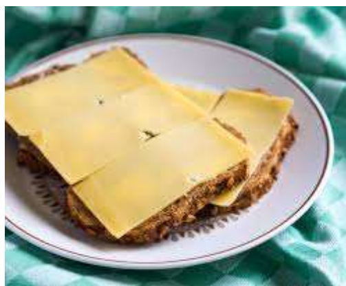
Tarwebrood met kaas.

Dat was het volgens de overlevering ook al in de dagen van Prins Maurits (1567-1625). Die maakte eens zo'n lange ochtendwandeling dat hij honger kreeg. Daarop vroeg hij een schipper om brood. Maar om die boterham te krijgen moest hij eerst het schip mee trekken. Toen er tijd was voor het ontbijt, legde de prins kaas op zijn gesmeerde broodje. Maar de schipper was daar niet van gediend, en hij zei: 'Zo is het land niet rijk geworden!'