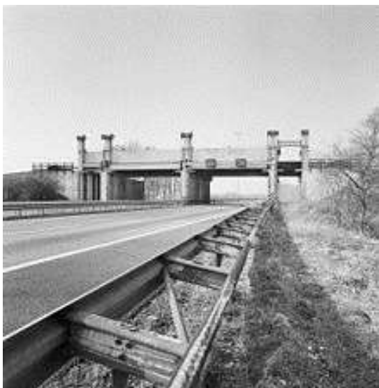
De oude schuiven in de A2.

In de loop van de dertiende eeuw was de wateroverlast zo groot, dat andere maatregelen noodzakelijk werden. Het grootste probleem was dat het rivierengebied van oost naar west afloopt, waardoor de laagst gelegen polders in het westen al het water van de hogere gronden in het oosten te verwerken kregen. Om de polders hiertegen te beschermen, begon men met de aanleg van dwarskades. Deze lagen min of meer noord-zuid gericht, tussen de grote rivieren in. In 1277 werd de Zouwe- of Bazeldijk aangelegd, die het water dat uit de Vijfheerenlanden de Alblasserwaard instroomde moest keren. Na de aanleg van deze dijk nam de wateroverlast in de Vijfheerenlanden uiteraard sterk toe.