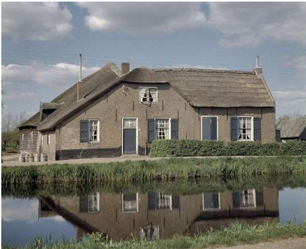
Een pracht van een hofstee.

De naam Vuilendam wordt al in 1369 gebruikt, maar wordt later ook wel geschreven als Vuylendam.