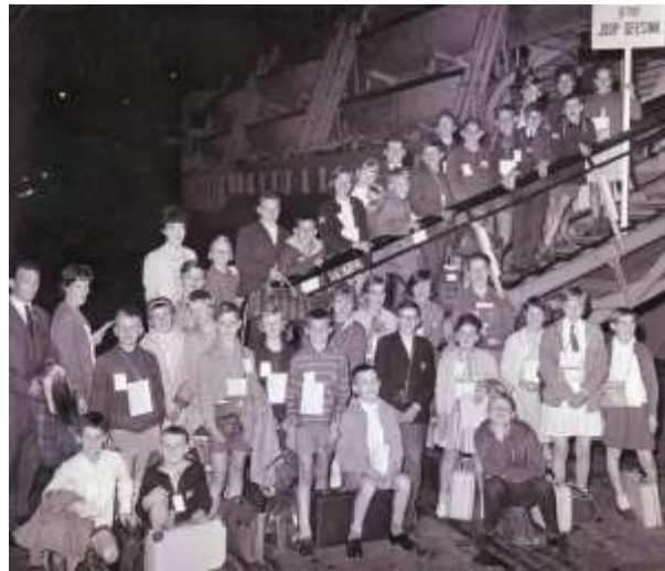
In 1961 mocht een groep M-brigadiers op reis met een echt cruiseschip.

Deze zomer was in Museum De Koperen Knop een expositie, getiteld Kaas & Koe. Om aan materiaal te komen werd er onder meer een oproep in de krant geplaatst. Dat was aanleiding voor flink wat bruikbare reacties. Een inwoner van Hardinxveld-Gies-sendam mailde een paar foto's, waarvan in eerste instantie werd gedacht 'Wat moeten we daarmee?'. Maar al snel werd duidelijk dat het hier gaat om foto's van een reis in het kader van de Melkbrigade.