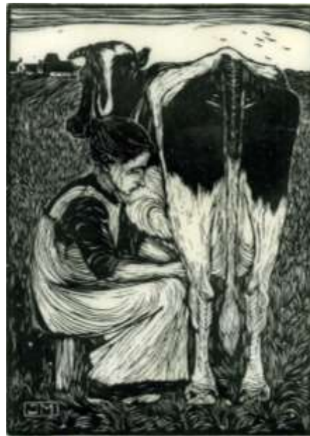
Jan Mankes (1889-1920)