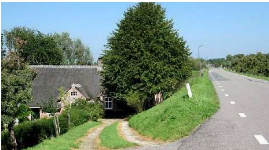
Een typisch beeld van de Diefdijk.

Het gebied van de Alblasserwaard en de Vijfheerenlanden is omringd door dijken. Dijken die het gebied beschermen tegen de invloed van het buitenwater. En in het zuiden, het westen en het noorden stroomt er ook echt water langs die dijk. Maar in het oosten is het anders. Daar ligt de Diefdijk.