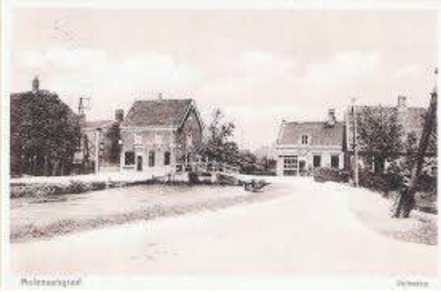
Rechts een oude foto van Vuilendam.

Het valt ter plekke op dat ieder deel is voorzien van eigen plaatsnaamborden, met de respectievelijke dorpsnamen in blauw (komborden) en eronder de buurtschapsnaam Vuilendam in wit, zodat je je ter plekke ook bewust wordt van de bijzondere grenssituatie, én kunt zien welk deel onder welk dorp valt.