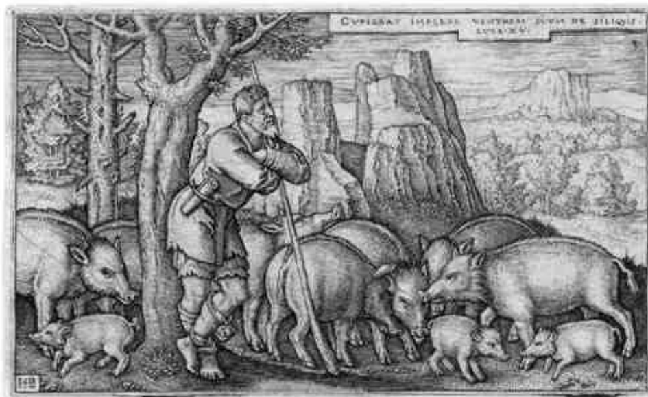
Koperprent uit 1538 van Sebald Beham (1500-1550)

Een voor andere zaken veel gebruikte dierennaam is die van het varken. En dan voornamelijk in de bouwnijverheid. Soms alleen het mannetjesvarken, de beer. Niet te verwarren met de bruine beer. Hier een opsomming van de benamingen: