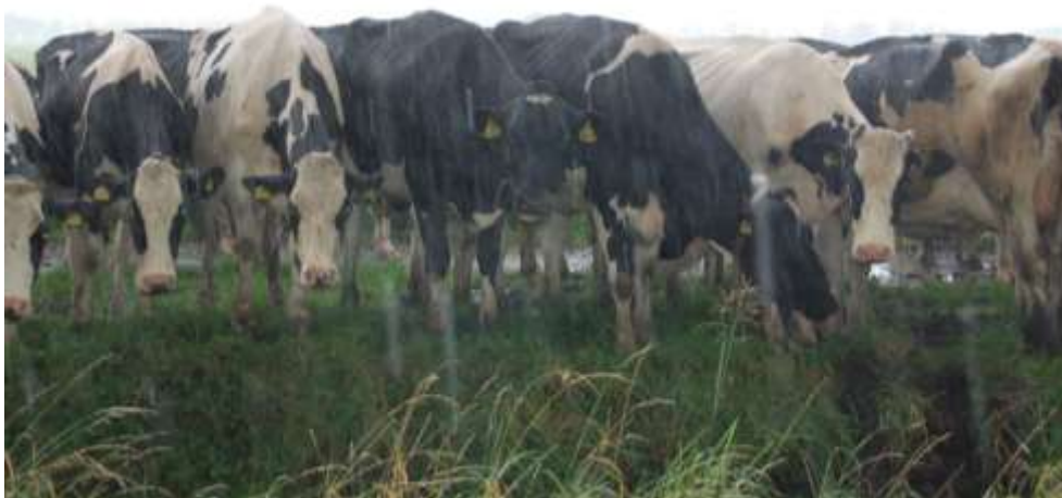
Koeien in de regen...

Sluis 57 2964 AT Groot-Ammers 0184-661425/06-53759618 secretaraat@boerderijenerf.nl INL14RABO0325074739 www.boerderijenerf.nl