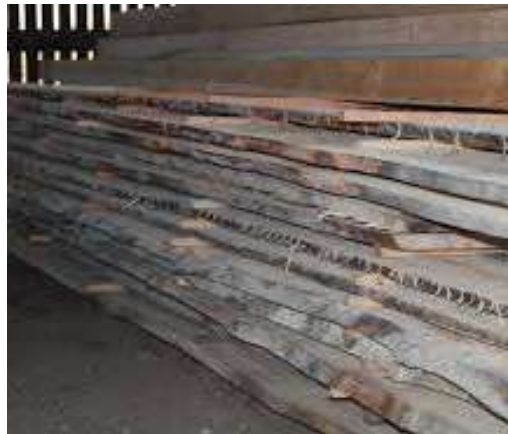
Gezaagde kantdelen in een droogloods.

Van oorsprong zal men vooral het hout hebben gebruikt dat in de directe omgeving van de bouwplaats van een boerderij te vinden was. Het model van de ontginningsboerderij uit Hoornaar laat dat goed zien. In het rivierengebied waarvan de Alblasserwaard en de Vijfheerenlanden deel uitmaken was weinig geschikt hout voorhanden. Dit en een toenemende kwaliteitseis deed een georganiseerde aanvoer van hout ontstaan. Daardoor ontstond een levendige houthandel. Dordrecht werd hierbij de belangrijkste stapelplaats voor Holland. Alle via de Rijn en de Maas aangevoerde hout moest via de stad Dordrecht worden verhandeld. Het aanvoeren van het hout, in vloten over de rivier, had als bijkomend voordeel dat het hout dan direct werd gewaterd. Maar ook in de Dordtse havens lag veel hout, soms meer dan een jaar in het water te drijven. Door dit wateren verdwenen de groeisappen uit het hout, waardoor het ongewenst krom of scheluw trekken en krimpen en