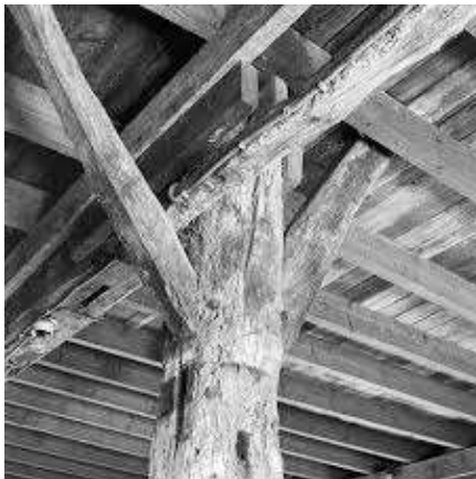
In boerderij werd veel hout gebruikt.

Hout is heel lang een van de belangrijkste bouwmaterialen van ons land geweest. Nog tot enkele eeuwen terug werden ook boerderijen geheel van hout gebouwd. Alleen wie het kon betalen versteende langzamerhand zijn hofstee. Voor het eerst in de zeventiende eeuw, toen er enige welvaart kwam nadat de tachtigjarige oorlog was afgelopen. Dat verstenen, het vervangen van wanden door muren, ging zeer geleidelijk en het eerst waren de voorhuizen van de boerderijen aan de beurt. Tal van boerderijen hebben pas in de twintigste eeuw een stenen stalgedeelte gekregen en een deel van veel achterwanden is nog steeds van hout. In veel steden was het al eerder gewoonte geworden om stenen huizen te bouwen, omdat tal van stadsbranden het gebruik van hout voor buitenwanden had verboden.