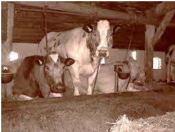
Een prachtige oude stal.

We krijgen het druk, als Stichting Boerderij & Erf. De kranten melden onlangs: 20% minder koeien. Dat houdt in dat in ons land duizenden boeren ermee gaan stoppen. Althans dat zijn de berichten. En de veroorzaker: het mestoverschot. U kent wellicht de variant op de uitdrukking 'tot de dood ons scheidt': 'tot de schijt ons doodt'. Het begint werkelijkheid te worden.