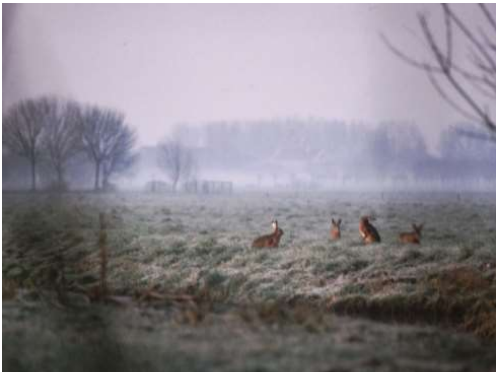
Zaten 'vier' haasjes heel pammant

Sluis 57 | 2964 AT Groot-Ammers | 0184-661425/06-53759618 secretariaat@boerderijenerf.nl | NL14RABO0325074739 | www.boerderijenerf.nl