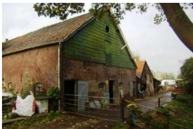
Een bedrijvig stukje boeren erf.