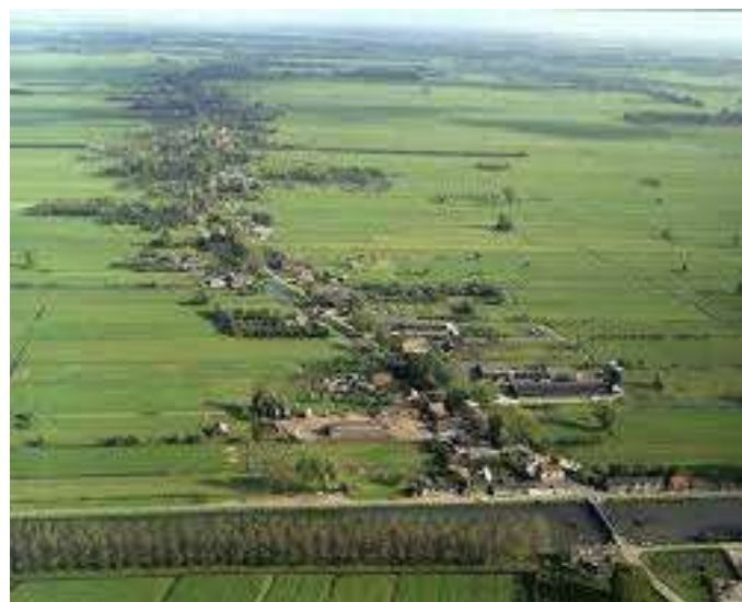
Lintbebouwing van Hei- en Boeicop.

Bouwen en verbouwen zijn activiteiten, die veelal weloverwogen worden gedaan. Velen zullen hierbij niet over een nacht ijs gaan en zich afvragen wat de beste combinatie is tussen wat er uiteindelijk gaat ontstaan en wat de kosten zijn om het zover te laten komen. Dat speelt overall, maar vooral op het platteland valt op hoe belangrijk het is dat de hierbij te maken keuze een in de omgeving passende is.