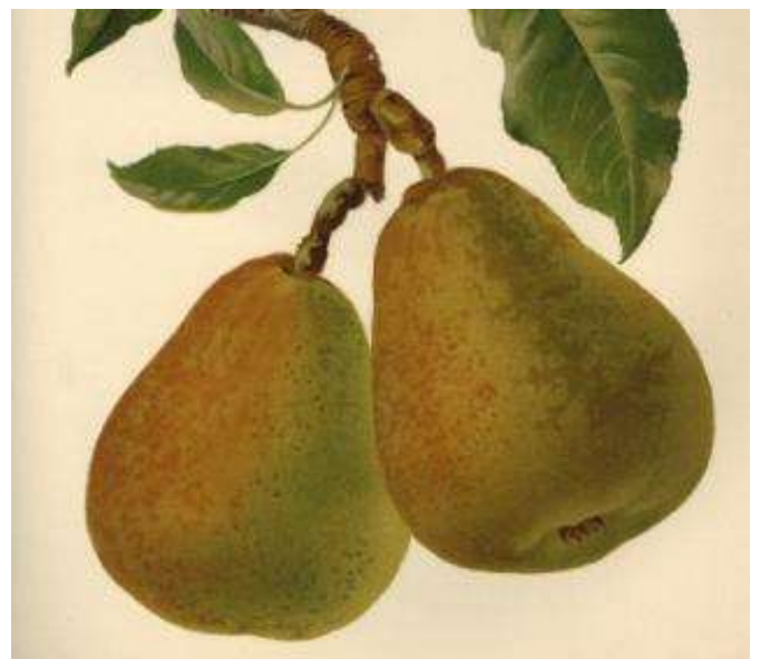
Pyrus communis 'Belle Lucrative' - een ware delicatesse.

En dan waarom de peer? Omdat dit een vrucht is die vroeger op bijna elk boeren erf wel te vinden was en die in de zomer van weleer het meest werd gegeten en gebruikt bij het bereiden van maaltijden.