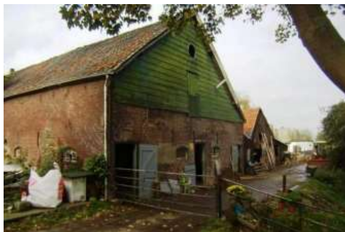
Een bedrijvig stukje boeren erf.