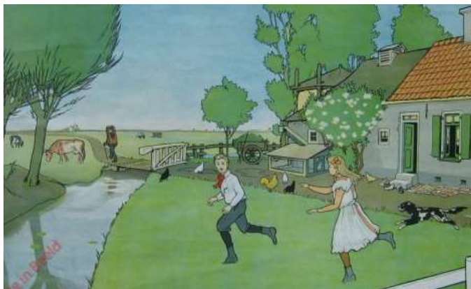
Schoolplaat met links op de achtergrond een vertrekkende marskramer.

verkoopmaterialen, waren er de oorzaak van dat deze ambulante handel inmiddels zo goed als verdwenen is uit ons land.