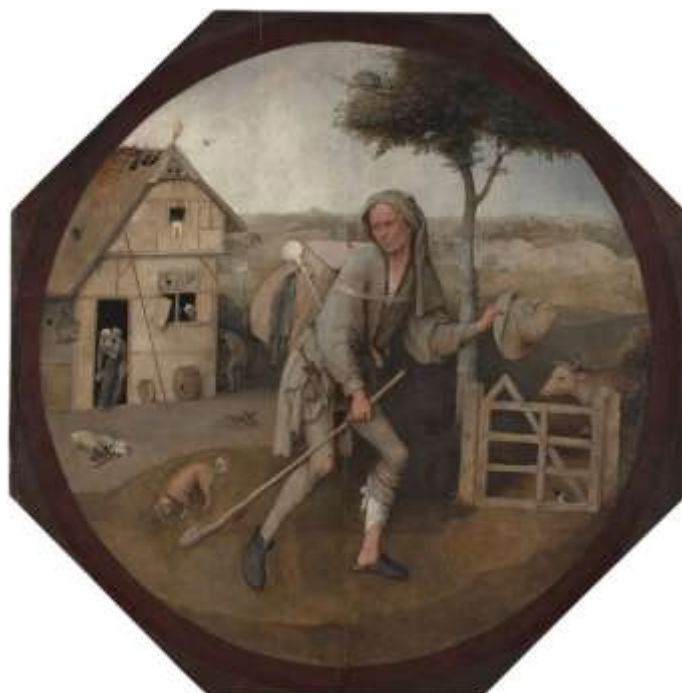
Een landloper of marskramer gaat 'op een slof en een oude schoen' en staat voor de mens op zijn levenspad. Hij is een soort 'Elckerlijc', naar de gelijknamige laat 15 e eeuwse zedenshets. Het is de 'homo viator', de pelgrim die op zijn levensweg gebukt gaat onder de lasten van zijn aardse bestaan. Hij torst zijn last op het pad vol verleidingen. Het schilderij is eind 15 e eeuw gemaakt door Jeroen Bosch.

Op de veraf gelegen boerderijen waren ze een geziene gast en werden vaak uitgenodigd een boterham mee te eten. Dat was echter niet overal het geval. Het kwam ook voor dat de hofhond op de marskramer werd afgestuurd. Meestal hadden deze vriendelijke mensen ook nog een andere functie, namelijk die van bringer van het nieuws of die van bemiddelaar. Daarbij kwamen ook taal, geschiedenissen en gebeurtenissen aan bod.