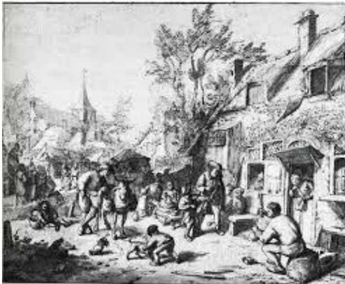
Een kermis was een feest van ontmoeting.

In de vorige editie van deze digitale nieuwsbrief werd al aandacht geschonken aan het ruwe leven ten tijde van de dorpskermis. In de beschrijving van Herman de Man lezen we zaken, waarvan we nu het nodige zouden denken. We moeten hetgeen wordt beschreven echter zien in de tijd dat het zich afspeelt.