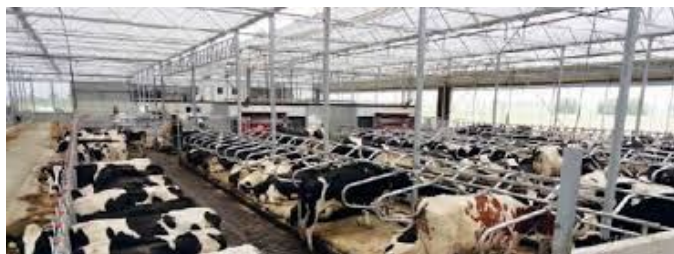
Het knusse samenwonen in een serrestal.

Na ontvangst bij de Natuur- en Vogelwacht in Papendrecht ging de reis per bus naar Slingeland. Voor de eerste stop. Daar kreeg het gezelschap uitleg over de manier waarop bij de aanleg van de weg / het wegprofiel er met gebruikmaking van natuurlijk aanwezige zaken een verkeersvriendelijke situatie kon worden gerealiseerd. Geen drempels, geen belijning. Gewoon netjes, glad en rustig asfalt. Overigens een resultaat van nauw overleg en bereidheid om met elkaar en vooral met de bewoners in de omgeving te praten. Verkeersdrempels zijn niet prettig, niet voor de verkeersdeelnemer en vooral ook niet voor de bewoners in de nabijheid, die elke keer wordt geconfronteerd met afremmende en enigszins bonkend de drempel overrijdende auto's.