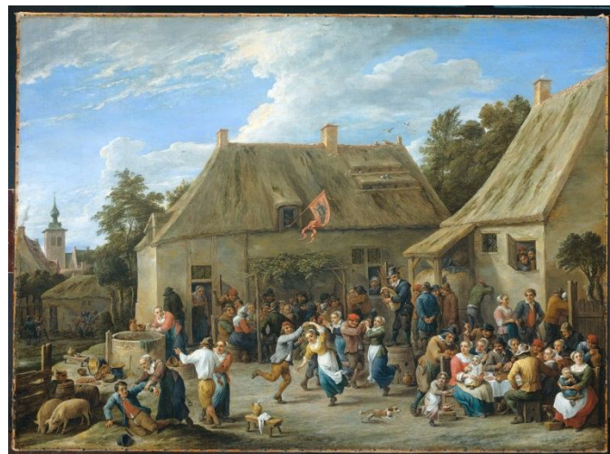
Een dorpskermis in volle gang.

In de loop van de tijd is de religieuze betekenis van de kermis steeds meer naar de achtergrond verdwenen en kregen handel en vermaak de overhand. Vormen van amusement die men op de kermis kon vinden waren bijvoorbeeld goochelaars, dierentemmers en verschillende spelletjes. Katknuppelen was een populair spel. men stopte een levende kat in een ton en sloeg hier net zo lang met een houten stok op totdat de ton uit elkaar viel en de kat in doodsangst wegrende.