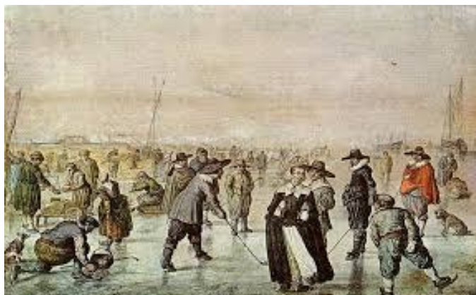
IJs en vermaak hebben iets met elkaar gemeen.

tie van de kermis verdween. De kermis was alleen nog een plek van amusement en vermaak. In de ogen van de veelal Calvinistisch georiënteerde bevolking paste dat niet. Zeker niet gezien de uitpattingen, die een dergelijk volksfeest teweeg kon brengen.