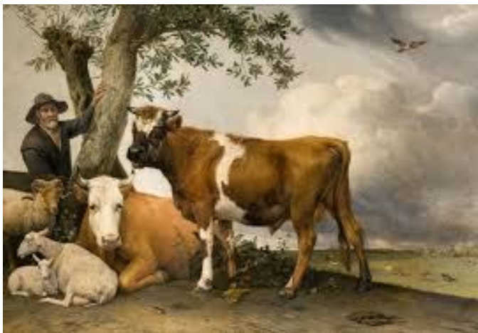
De stier van Potter.

Al een aantal keren dit voorjaar heb ik mezelf betrappt op vrolijk verraste uitroepen wanneer er ergens koeien in een weiland lopen. Het is natuurlijk te gek voor woorden dat je daar als Nederlander blij van wordt. Nederland, weilanden en koeien: het was eeuwenlang een soort heilige drie-eenheid, resulterend in een wereldwijde export van Fries melkvee en kaassoorten als Edam en Gouda.