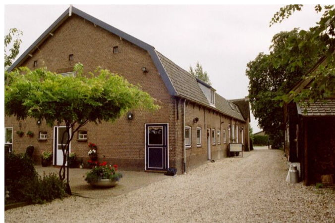
Niet monumentaal, wel karakteristiek.

Daar gaat het om bij het behoud van de boerderij als icoon in het landschap. Dat hoeft echt niet alleen een monumentale boerderij te zijn. Dus niet alleen op gemeentelijke-, provinciale- of rijkslijsten vermelde panden. Ook andere panden hebben een monumentale uitstraling. Maar zelfs dat is niet nodig om als karakteristiek te worden bestempeld. Als voorbeeld de boerderijen langs de A27 bij Meerkerk. Vooral toen ze destijds net nieuw waren gebouwd, waren dat plaatjes. Louter vanwege de herhaling. Intussen hebben er wat verbouwingen plaatsgevonden, maar toch herkent iedereen de gelijkheid van weleer nog. Zo staan er in ons werkgebied ook moderne boerderijen. Daarbij zijn best wat exemplaren, die het predicaat karakteristiek zouden mogen dragen. Tegelijkertijd gebiedt de eerlijkheid om toe te geven, dat er ook wangedrochten onder staan.