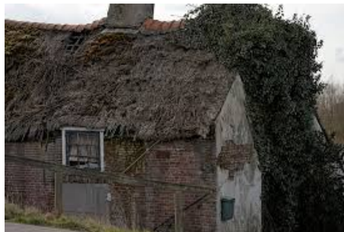
Bouwval in Sluis.

De afsluiting vond plaats, midden in het boerenland, met aan drie kanten ruilverkavelingsboerderijen. Op elk van die boerderijen was wel wat af te dingen.