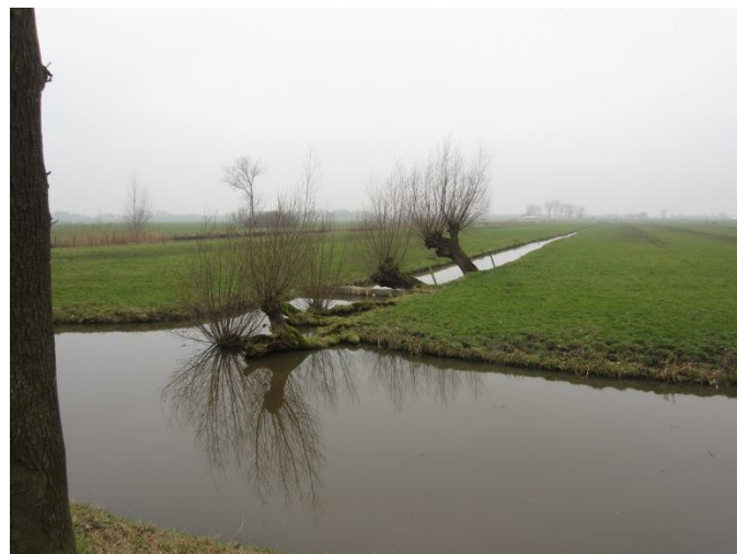
Dat is lastig knotten...