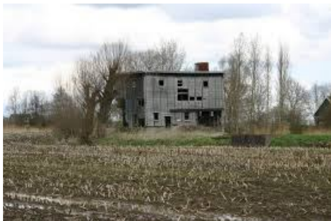
Sommigen verwaarloosde panden zijn het behoud in hun verwaarloosde staat meer dan waard; wat zou het leeg zijn zonder dit...

Met dank aan: Marijn Heijers en Ruben Abeling.