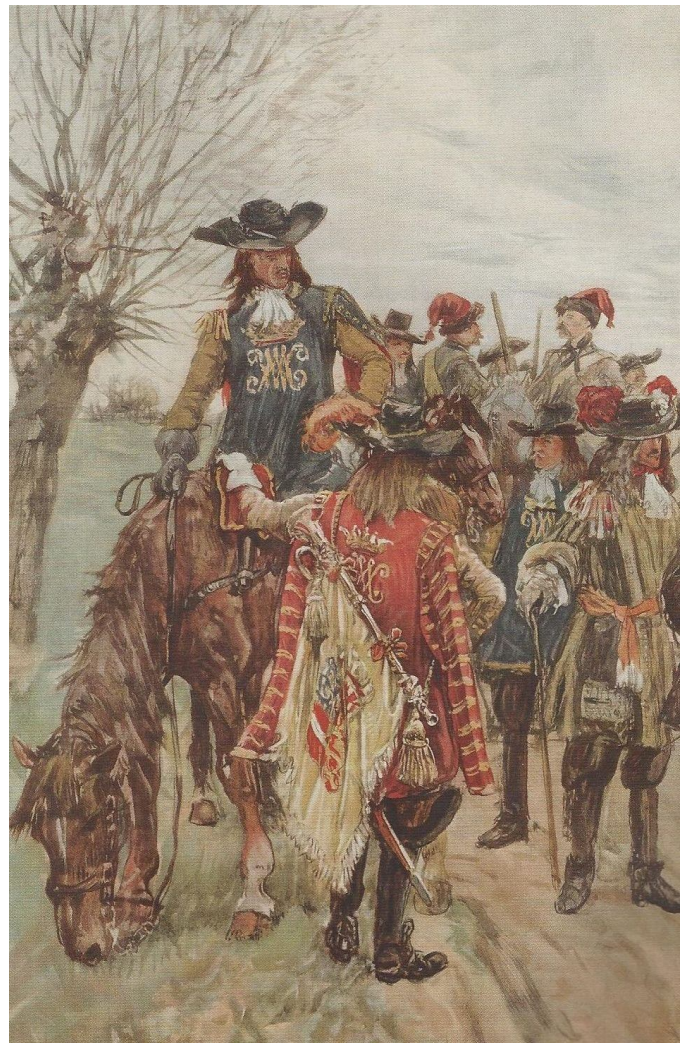
Knotwilg op oude schoolplaat.

Het bezoek van Prins Willem III in 1672 aan de Hollandse waterlinie, was later aanleiding hier een schoolplaat aan te wijden. Op dit fragment hiervan is links heel duidelijk een knotwilg te zien. Die knotwilg is niet voor niets op die plek terecht gekomen. Eeuwenlang is de knotwilg al van belang voor ons landschap. Nu de tijd van knotten, maar ook die van de aanplant van nieuwe wilgen weer aanbreekt, willen we hier toch een lans voor breken. Behoud ook de knotwilgen, want het feit dat hun aantal steeds meer afneemt is een groot gemis voor het landschap van de Alblasserwaard en de Vijfheerenlanden.