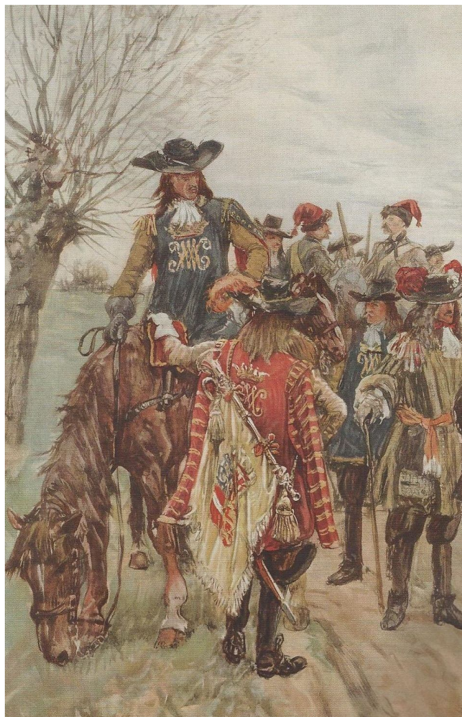
Knotwilg op oude schoolplaat.

Het bezoek van Prins Willem III in 1672 aan de Hollandse waterlinie, was later aanleiding hier een schoolplaat aan te wijden. Op dit fragment hiervan is links heel duidelijk een knotwilg te zien. Die knotwilg is niet voor niets op die plek terecht gekomen. Eeuwenlang is de knotwilg al van belang voor ons landschap. Nu de tijd van knotten, maar ook die van de aanplant van nieuwe wilgen weer aanbreekt, willen we hier toch een lans voor breken. Behoud ook de knotwilgen, want het feit dat hun aantal steeds meer afneemt is een groot gemis voor het landschap van de Alblasserwaard en de Vijfheerenlanden.