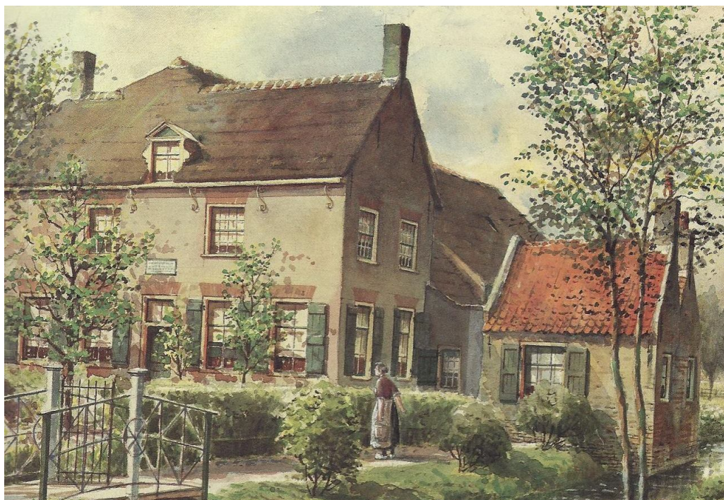
Dubbel stookhuisje bij boerderij in Dubbeldam Detail van aquarel van J. Verheul Dzn uit Boerderijen in Zuid-Holland – Zutphen z.j.

Hoewel mijn nieuwsgierigheid is gewekt en ik waar mogelijk zeker nog eens wat zal lezen over dit onderwerp is me al wel duidelijker wat er aan de hand is. Vroeger, heel vroeger, waren er bij een aantal boerderijen bakhuisjes, waar buiten de boerderij brood werd gebakken. Dat gebeurde vanwege het brandgevaar bij de veelal van hout opgetrokken en met riet gedekte boerderijen. Later, toen het bakken van brood een ambacht werd, die een bakker als commerciële activiteit ging uitvoeren, raakten de bakhuisjes in onbruik. In streken als de Alblasserwaard, waar al in de 15 e eeuw van graanteelt werd overgegaan op veeteelt en waar bovendien een relatieve rijkdom was, werden de bakhuisjes al wel eerder verlaten. Soms werden ze herbestemd tot stookhuisje en zal in de loop van de tijd de bakoven er uitgesloopt zijn, omdat die in de toch al weinige ruimte danig in de weg zat. Er zullen ook bakhuisjes zijn verdwenen omdat toen ze geen functie meer hadden ook niet meer werden onderhouden. Maar in het spraakgebruik zal men lange tijd nog over bakhuisjes hebben gesproken als er stookhuisjes zijn bedoeld. Tot op de dag van vandaag.