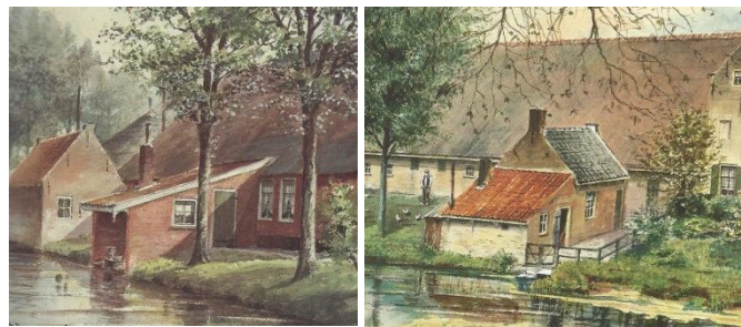
Stookhuisjes uit Woerden (l) en Wieldrecht. (Details van aquarellen van J. Verheul Dzn uit Boerderijen in Zuid-Holland – Zutphen z.j.)

Laten we met het gemakkelijkste beginnen: Het huisje op pagina twee heeft zeker geen zadeldak, maar een lessenaarsdak. Wat de bakhuisjes betreft, ligt alles een stuk ingewikkelder. Het artikel is geruime tijd terug door iemand opgestuurd en later bleek een vergelijkbare ver