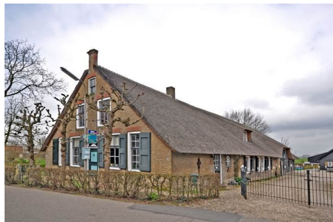
Een van de foto's, die niet in het boek komen... Maar wie bedenkt voor zo'n pand nu een bushalteaanwijzing? Een cultuurbaar!

Sinds kort hebben we een definitieve titel: 'DE BOERDERIJ het behouden waard'. Dat past precies bij waar we met elkaar aan werken.