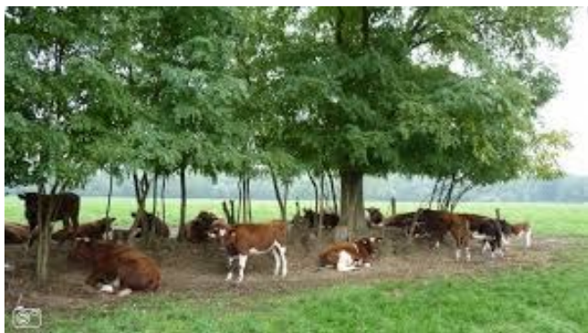
Een plek om te schuilen.

Op het moment dat ik deze nieuwsbrief opstart is het de warmste dag van 2013, tot nu toe. Ik heb het over de tweede augustus. Ik sta op het punt met (of is het op?) vakantie te gaan. Dat betekent niet alleen 'pakken', maar vooral ook een boel dingen afronden. Dit laatste houdt ook in dat ik de afgelopen twee dagen nog wat slepende zaken heb afgewikkeld. Daarbij reed ik meerdere keren door ons prachtige gebied de Alblasserwaard en de Vijfheerenlanden. En dan zou je denken: blijf dan thuis als je dit gebied zo mooi vindt. Neen: je leert je eigen omgeving pas echt waarderen als je elders bent geweest. Thuiskomen is het mooiste van een vakantie... Bij mijn tochten door de streek zag ik koeien in allerlei omstandigheden. Ik zag ook dat er op sommige weilanden geen enkele schaduwmogelijkheid was. Vroeger stonden overal knotwilgen, maar die vragen teveel onderhoud, dus zijn ze verdwenen.