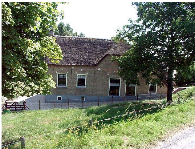
Waardevolle bomen bij boerderijen vragen om nader onderzoek.

Om hun werk voor te kunnen zetten zoeken zij samen met het bestuur van BV&E A-V vrijwilligers, die de geregistreerde bomen willen koppelen aan de boerderijen. Een leuke klus, ook in de zomermaanden om per fiets te doen. Reacties graag naar het secretariaat.