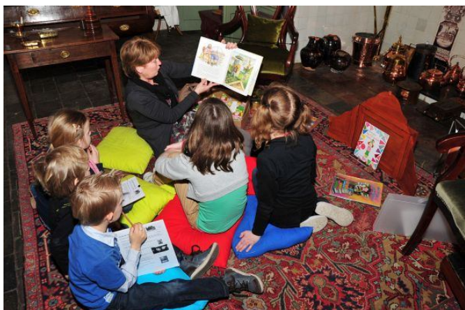
Museum De Koperen Knop, een voormalige boerderij, organiseert regelmatig voorleesuurtes.

Dan de vraag of er misschien onder u mensen zijn die willen meewerken aan een verhalenroute. We gaan namelijk proberen of er een route kan worden uitgezet, waar eens in de zoveel tijd in boerderijen op vaste tijden een verhaal wordt verteld of voorgelezen, dat slaat op die boerderij of op de omgeving daarvan. Meld u aan. Ook als u namen weet van anderen, die dat kunnen.