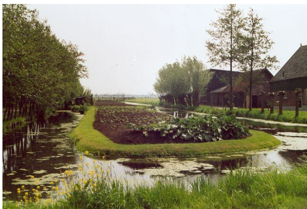
Voorjaar in de Alblasserwaard.