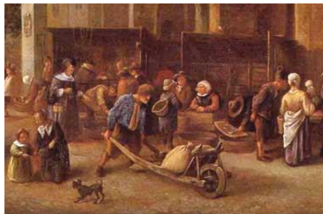
De handel komt op gang, blijkens dit schilderij uit de gouden eeuw.

In de begintijd verrichtten veel boeren vaak nevenactiviteiten, die wel vaak direct met het boerenbestaan van doen hadden, zoals grienteelt, visvangst en het houden van eendenkooien. De gemiddelde veestapel bestond toen uit vier tot zes koeien. Een heel grote boer had er tien. Voor het gemiddelde boerenbedrijf was er een lap grond van 15 morgen nodig.