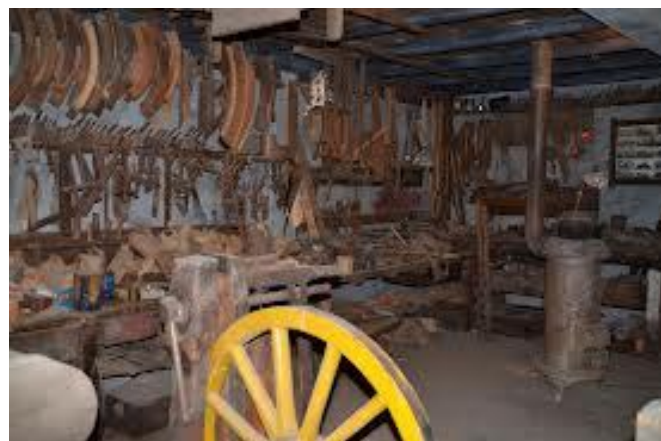
Interieur van de Wagenmakerij van Van Peet in Meerkerk.

Twee gebruiksvoorwerpen moeten nog worden genoemd, de remketting en de polderboom. De remketting was bedoeld om de wagen tot stilstand te brengen of vast te zetten, maar vooral om deze in snelheid te matigen als deze van de hoge rivierdijk af moest. De polderboom (ook ponterboom, pongerboom of wezeboom) bestond uit een lang rondhout dat ter zekering over de lading een werd gespannen. Dit zal bij het vervoer van hooi uit drassig land met diepe kuilen in de rijpaden zeker nodig geweest zijn.