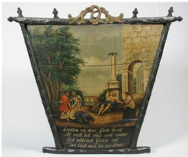
Achterklep of achterkrat.

Voorop de wagen bevond zich de zittekist, die dienst deed als bok voor de voerman. Ook de zittekist was versierd met houtsnijwerk. Het deksel van de kist kon scharnieren, waardoor de kist benut kon worden voor een twaalfuurtje van de voerman, wat gereedschap of een oude deken, die bij vervoer van personen wel van pas kwam.