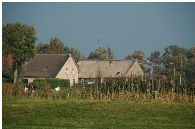
Zomaar een plaatje...

Voor het geld hoeft u het niet te laten. Voor het luttel bedrag van € 17,50 krijgt u twee keer per jaar de gedrukte versie van de nieuwsbrief thuisgestuurd, de digitale nieuwsbrieven in uw mailbestand, een uitnodiging voor een voorjaarsvergadering met lezing en een uitnodiging voor de najaarsvergadering met excursie. Ook tussendoor wordt u op de hoogte gehouden en kunt u Boerderij & Erf A-V raadplegen.