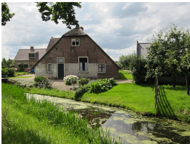
De geschiedenis patst er van af...

Dit door M.A. van den Broek geschreven boekje kost € 16,95 (boekwinkel en webwinkel van Boekscout.nl).