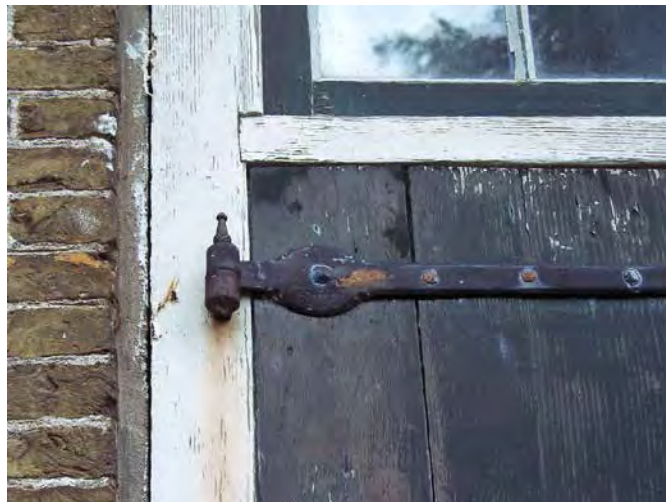
Stilleven... misschien is het hier wel te lang stil geweest!