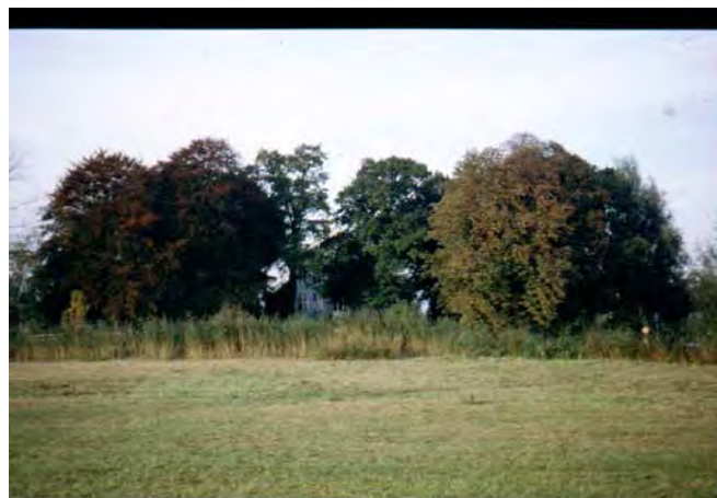
Monumentale bomen om een boerderij.