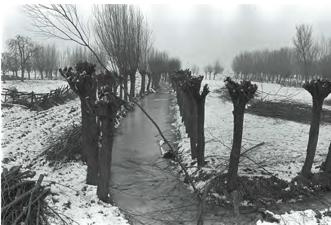
Stilleven in de polder. Een prentje dat van alles in herinnering roept.