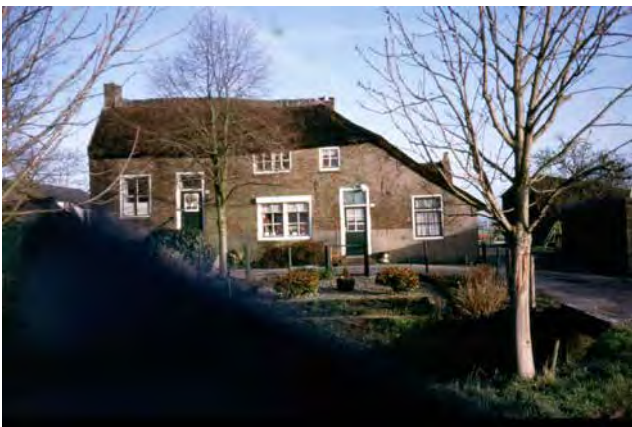
Het inventariseren waard.

Het is allereerst van belang dat in beeld komt wat er aan waardevolle panden zijn, of die een monumentenstatus hebben en of daar foto's van zijn. Van uit de