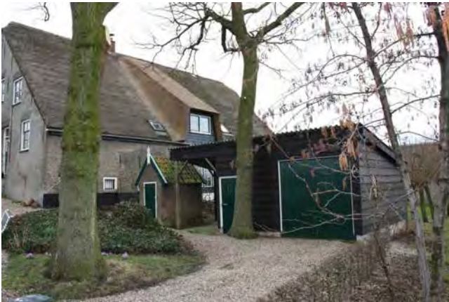
Een stukje boerenerv.