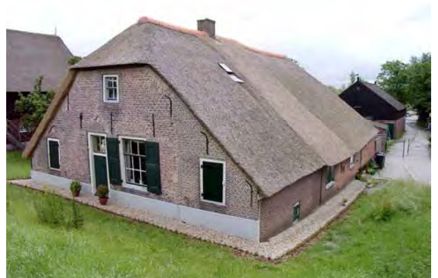
De juiste verhouding in de roedeverdeling in een raam luistert nauw.