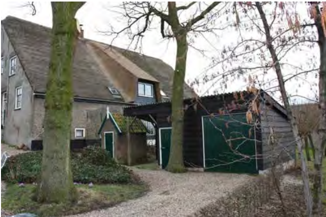
Een stukje boerenerv.