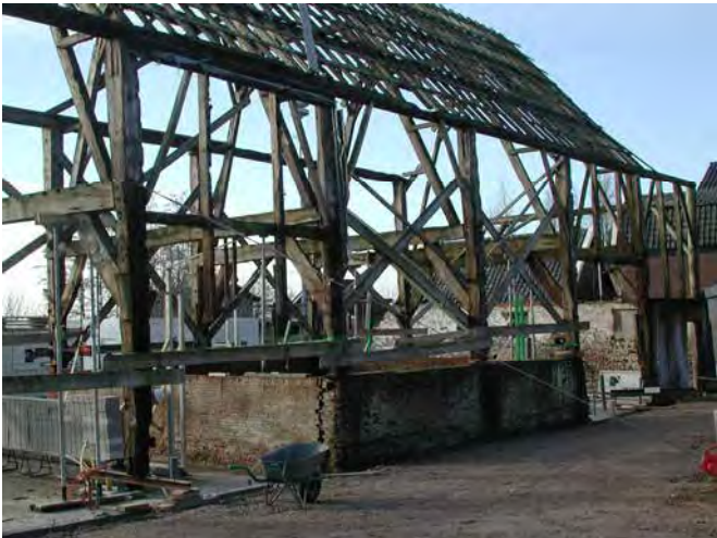
Maak gebruik van wat er is.

doende hofstee in de weg staat. Denk hierbij aan het verbod tot splitsing van een boerderij in twee of meer woningen of het creëren van appartementen. Dit gebeurt vaak om de hoge jaarlijkse kosten over meerdere eigenaren te kunnen verdelen. Of is er de opgelegde plicht om de bijgebouwen op het boerenerf te slopen als een boerderij woonhuis wordt. Geef de – nieuwe – eigenaar de gelegenheid die gebouwen te betrekken bij de woning om het woongenot te vergroten, of om er iets van te maken, waarmee wat extra inkomen verdiend kan worden dat ten goede komt aan het behoud van de boerderij. Bovendien is een glad erf funest voor de fauna en flora ter plaatse. Juist op verrommelde boerenerven komen nog vogels, knaagdieren en reptielen voor en bevinden zich nog authentieke planten. Om dit goed aan te gaan pakken zijn Bert Hartman en Piet den Hertog momenteel aan het inventariseren wat hierover in de verschillende bestemmingsplannen is opgenomen. Dit zal leiden tot een rapportage, die overlegd gaat worden aan en vervolgens besproken met de gemeenten.