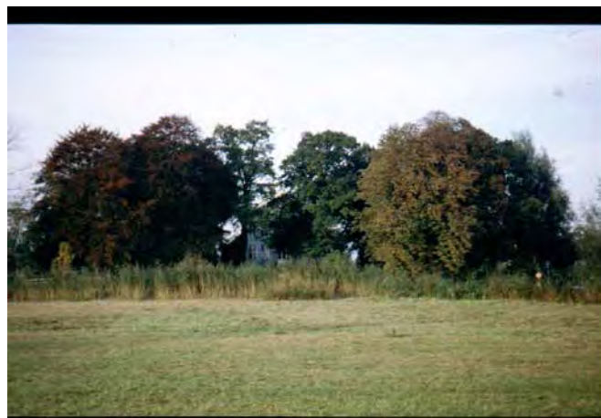
Monumentale bomen om een boerderij.